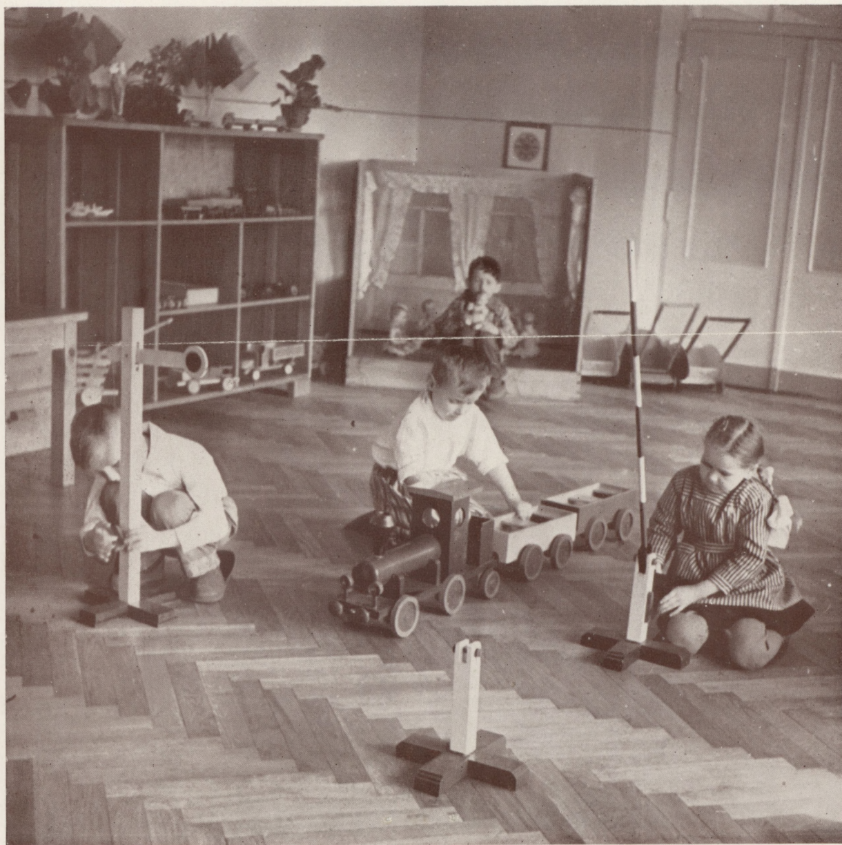
Crèche de l'usine de textile "Gwardia Ludowa" de Lodz