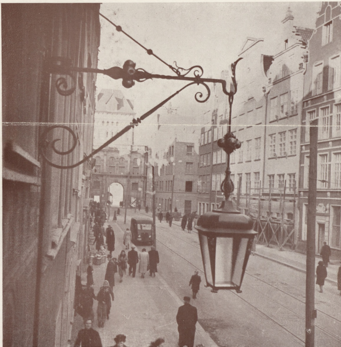
Un aspect de la reconstruction des vieux quartiers de Gdansk.