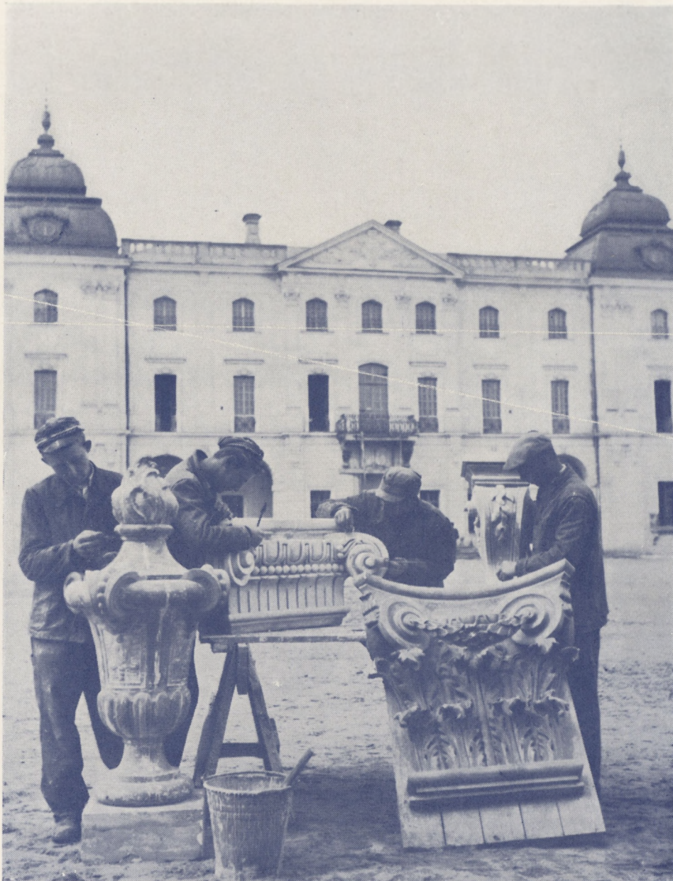
Reconstruction du Palais historique des Branicki à Białystok où siège actuellement l'Académie de Médecine