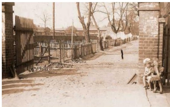
Wejście do "Madery".

skiej wyspie i sarkastycznego powiedzenia: „My tu w biedzie, a na Maderze świeci słońce tej cholery”. Była to dzielnica bezrobotnych i bezdomnych, którzy samowolnie zajęli w drugiej połowie lat 20. XX wieku budynki na terenie dawnych Koszar im. Stefana Czarnieckiego przy ul. Radzyńskiej (dzisiejszej ul. Hallera). Od 1926 roku wprowadzono się stopniowo do dziesięciu budynków, należących do Kolei Państwowych, w tym oprócz mieszkalnych zajęto także ustępowe, gospodarczy i kuźnię. Ich stan opisany został szczegółowo w protokole oględzin z 12 lutego 1931 roku i późniejszym sprawozdaniu Podkomisji dla spraw tzw. „Madery” z 10 września 1934 roku, szczególnie cennym źródle informacji. W 1927 roku Rada Miejska podjęła uchwałę o wydzierżawieniu od Ministerstwa Komunikacji dwóch budynków mieszkalnych (31a i 41a), a 11