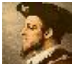
Zygmunt II August – od 1529 r. wielki książę litewski, od 1530 r. król Polski.

Za panowania Zygmunta I Starego doszło w 1519 r. do kolejnej wojny z Zakonem Krzyżackim. Władca przez wiele miesięcy przebywał w naszym regionie, a Toruń w tym czasie pełnił rolę głównej kwatery. Tam też odbyły się dwa zjazdy stanów pruskich. Natomiast Grudziądz, zgodnie z wolą króla stał się miejscem spotkania radców i komisarzy królewskich z posłami krzyżackimi. Przedmiotem rozmów było osiągnięcie porozumienia w sprawie zapobiegania jakimkolwiek zatargom.