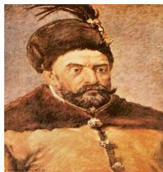
Stefan Batory – król Polski w latach 1576 – 1586.

Zygmunt II August będąc zwolennikiem tolerancji religijnej w 1559 r. zapewnił grudziądzanom swobodę wyznania. Uwzględniając specyfikę miasta (silny żywioł niemiecki) luteranie przejęli kościół św. Mikołaja, św. Ducha i położoną poza murami kaplicę św. Jerzego.