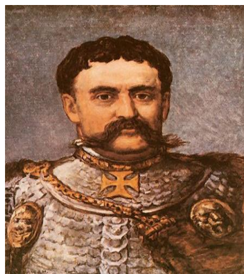
Jan III Sobieski – król Polski w latach 1674 -1696.

Ostatnim polskim monarchą, który przybył do Grudziądza był Jan III Sobieski.