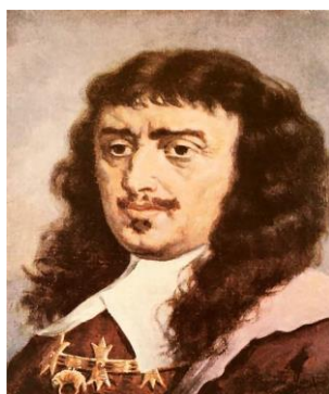
Jan II Kazimierz Waza – król Polski i wielki książę litewski w latach 1648 – 1668, tytularny król Szwecji do 1660 r.

Na czasy panowania Jana II Kazimierza, brata i następcy Władysława IV Wazy przypada niszczycielski „potop szwedzki”. Wojna ze Szwedami nie oszczędziła naszego miasta. Już 13 XII 1655 r. wojska szwedzkie wkroczyły do Grudziądza, okres okupacji trwał cztery lata. Król nigdy nie był w naszym mieście, ale płynąc statkiem z Warszawy do Gdańska we wrześniu 1651 r. mógł podziwiać jego panoramę. Władca kierując się realizmem politycznym zważywszy na silny żywioł niemiecki już w początkowym okresie panowania zagwarantował swobody religijne protestantom w Prusach Królewskich.