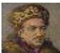
Kazimierz IV Jagiellończyk – wielki książę litewski w latach 1440-1492, król Polski w latach 1447-1492.