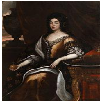
Maria Kazimiera de La Grande d'Arquien – królowa Polski w latach 1674-1696.

Po śmierci Władysława IV Wazy, Ludwika Maria stanęła na ślubnym kobiercu u boku Jana II Kazimierza. Przyjmuje się, że to z jej inicjatywy dokonano 1 IX 1656 r. ślubów lwowskich. W latach 1660-1667 była posiadaczką m.in. starostwa grudziądzkiego. Ubierała się wedle mody paryskiej. Wacław Potocki w swoich pamiętnikach tak pisał „Całe wstyd straciły panny i matrony, gdy na ponętę żądzy wdowy i mężatki ukazują piersi i nagie łopatki”. Jej damą dworu była Maria Kazimiera d'Arquien, późniejsza Marysienka Sobieska.