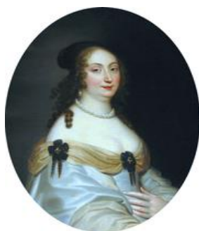
Ludwika Maria Gonzaga de Nevers – królowa Polski w latach 1646-1667.

Bilans strat ludnościowych i materialnych był tak ogromny, że 29 VIII 1659 r. król Jan II Kazimierz zwolnił Grudziądz od wszelkich akcyz i innych podatków na okres 20 lat.