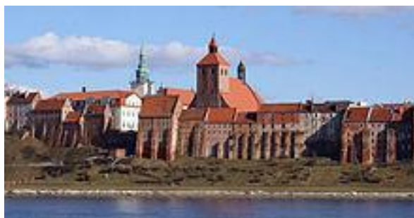
Spichrze widziane z lewego brzegu Wisły.

W XVI w. miasto przezwyciężyło kryzys spowodowany wojnami z Krzyżakami i stało się ważnym ośrodkiem handlowym. Świadectwem doniosłej roli naszego miasta w handlu rzeczonym regionu są spichrze.