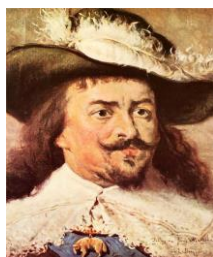
Władysław IV Waza – król Polski i wielki książę litewski w latach 1632-1648, tytularny król Szwecji 1632-1648.

Ostatni pobyt Zygmunta III Wazy przypadł na lata wojny ze Szwedami. Król zgromadził wojska pod Toruniem i wraz z synem Władysławem przebywał w tym mieście od 18 VIII 1626 r. Toruń w tym czasie pełnił rolę głównej kwatery wojsk królewskich. Stamtąd na czele siedmiotysięcznej armii wyruszył w kierunku Grudziądza, docierając do miasta 6 września. W dniach 13 – 15 września wojsko polskie w liczbie 11 tysięcy (wzmocnione posiłkami szlachty z terenów Prus Królewskich) na specjalnie wybudowanym moście pontonowym przeprawiło się na drugi brzeg Wisły. Pod koniec wojny w 1629 r. Grudziądz był ważnym ośrodkiem koncentracji wojsk królewskich, którego nie udało się zdobyć Szwedom. W tym samym roku król potwierdził wszystkie przywileje i zwolnił zubożale miasto od danin i kontrybucji.