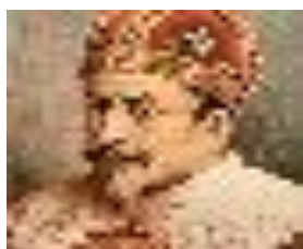
Zygmunt III Waza – król Polski i wielki książę litewski w latach 1587-1632.

Złoty wiek dla Grudziądza zahamowany został w wyniku wojen, jakie toczyliśmy na naszych ziemiach ze Szwedami. Okres ten przypada na panowanie trzech królów ze szwedzkiej dynastii Wazów.