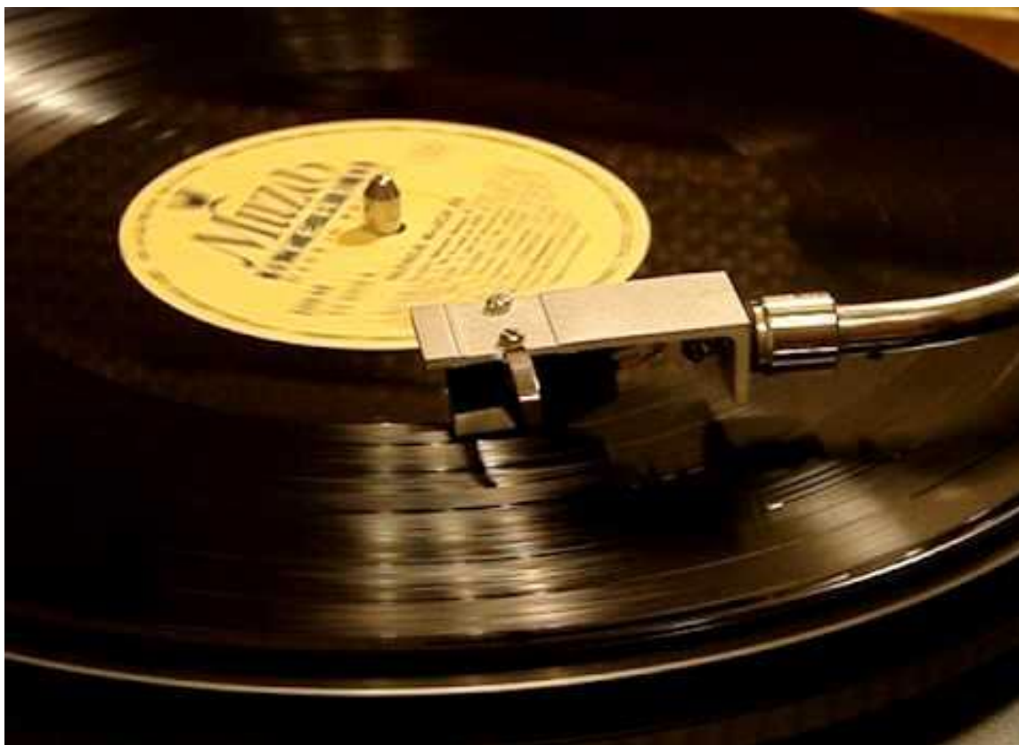
Wakacje z blondynką.