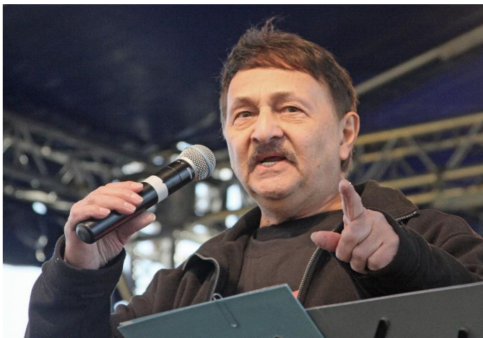
Zdjęcia z grudziądzkiego koncertu w 2012 roku.

Ponadto do jego repertuaru należą także piosenki: Mój płacz ukoi wiatr, Nie mówię żegnaj, Nie bój się do mnie pisać, Tylko Ty w Moim Sercu, Saga o cygance