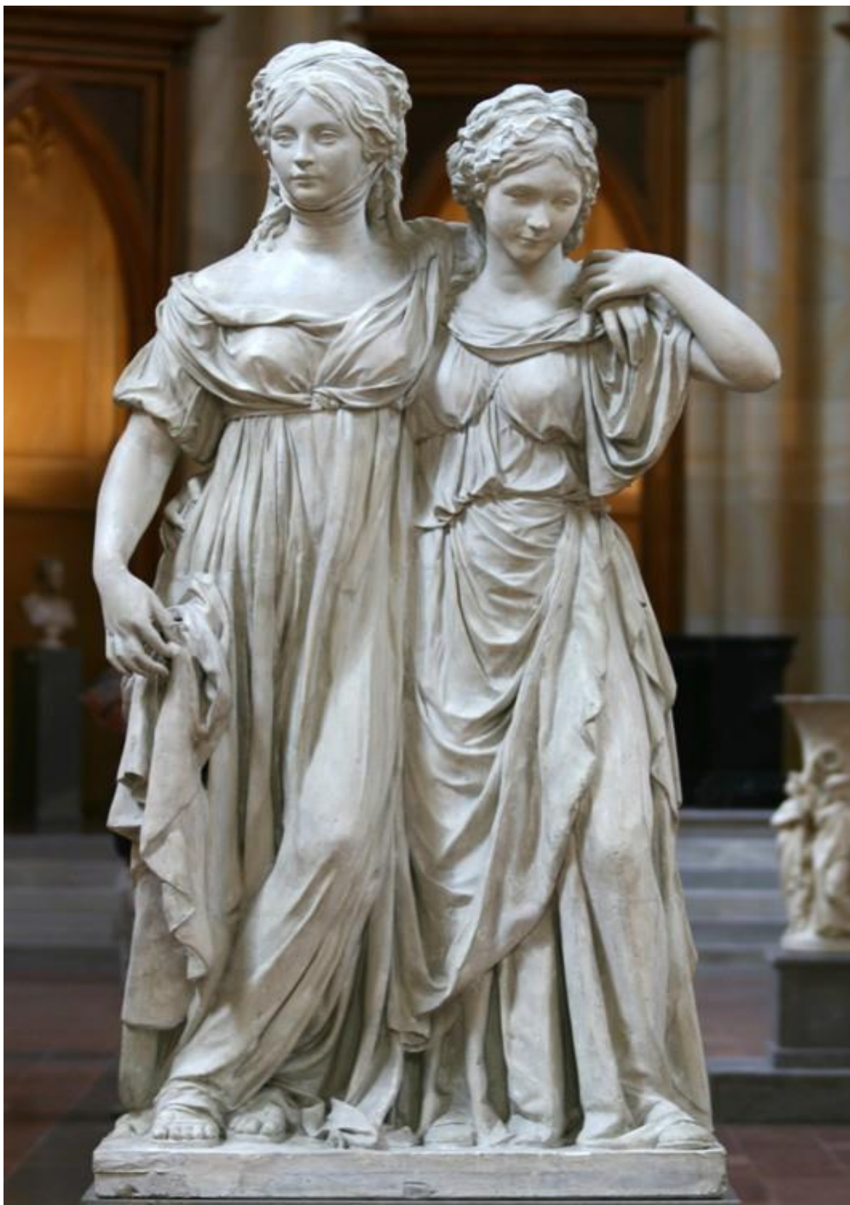
Księżniczki - siostry, od lewej Luise von Mecklemburg-Strelitz (późniejsza królowa) i Friedericke von Mecklemburg-Strelitz. Rzeźba Johanna Gottfrieda Schadow (1764-1850). Staatliche Museen zu Berlin talarów (15000) marek depozytu do szkoły kadetów w Chełmnie. (Ta kor-