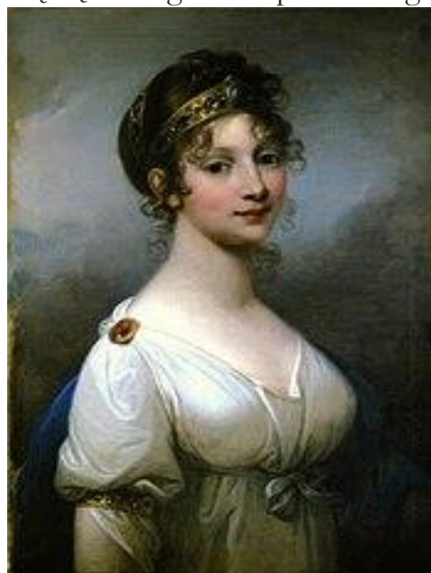
Królowa Luiza Pruska (1776-1810) Olej mal. Josef Maria Grassi 1802 r.

Uciekając z Berlina przez Bydgoszcz, nasza