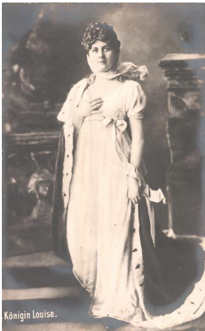
Królowa Luisa w płaszczu z gronostajów