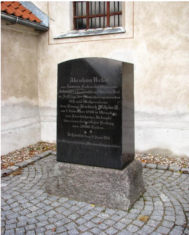
Obelisk w Szynychu