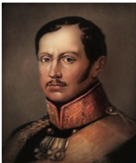
Król pruski Fryderyk Wilhelm III (1770-1840)

głęboko nieugięta para królewska, Fryderyk Wilhelm III i Luiza dotarła w dniu 3 listopada 1806 r. do Grudziądza, aby zatrzymać się tu na odpoczynek, aż do 16 listopada. W tak zwanym domu dowódcy garnizonu, w dużym budynku położonym obok starej bramy toruńskiej było w pośpiechu urządzone mieszkanie, przygotowane dla pary królewskiej. Dom mieści się przy Nonnenstraße 5 [ul. Klasztorna], służył każdorazowo dowódcy pułku jako mieszkanie na wynajem i zachował się do dnia dzisiejszego, natomiast