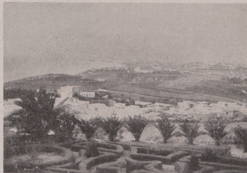
Tunis: widok z willi, w której mieszkał Naczelnny Wódz

Nazajutrz skok do Palestyny. Naczelnny Wódz dobił do głównego celu swej podróży. Pierwsze chwile — to żołnierski meldunek Dowódcy Armii i defilada na lotnisku. Pułk polskich ulanów, prowadzony przez swego młodego dowódcę — mało run-way'u nie rozbili. Młode, polskie twarze, opalone, brązowe kolana, zakasane rękawy koszul. Aż serce rośnie.