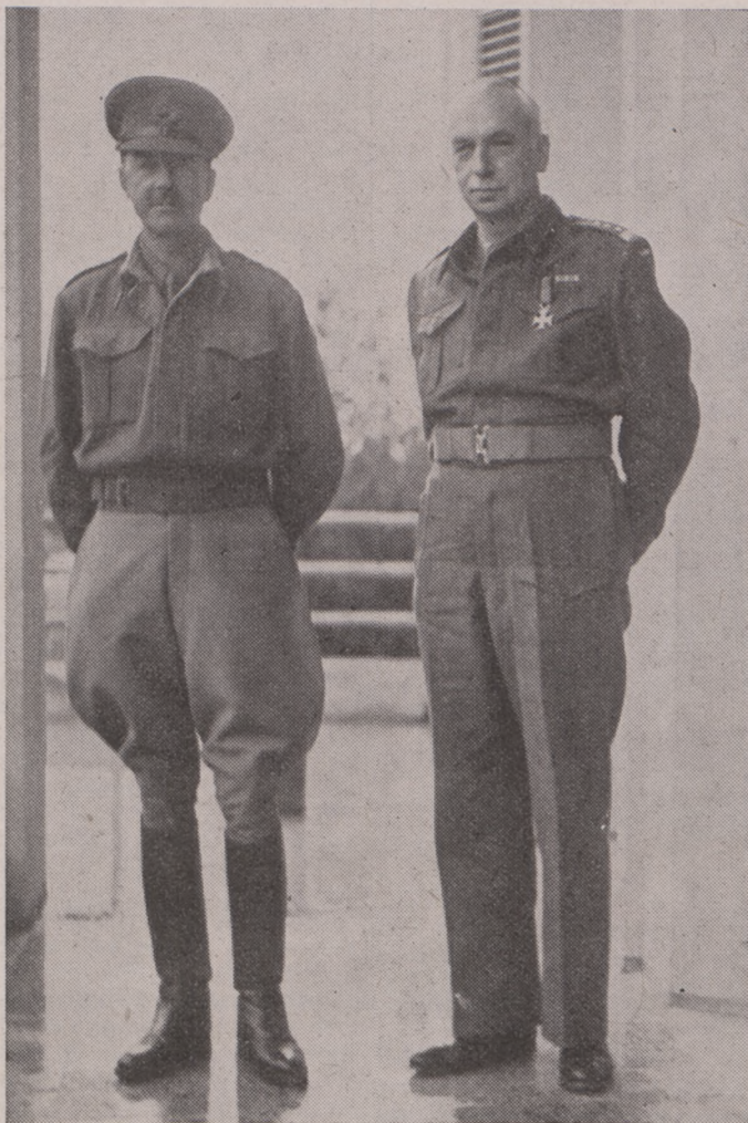
General Alexander i general Sosnkowski