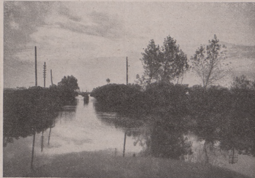
Libia czy . . . Polesie: droga do Castel Benito

znaleźliśmy się w Kairze. . . Przelecieliśmy nad niedawnym polem bitwy, zniżyliśmy się nad Tobrukiem, gdzie Brygada Karpacka wślawiła imię oręża polskiego, spoglądaliśmy ciekawie na Halfaya Pass — jak w filmie. Jeszcze wzrok mamy utkwiony w El Alamein, a już wylania się Kair. Wije się pod nami Nil, rysuje się wstążka Kanału Suezkiego.