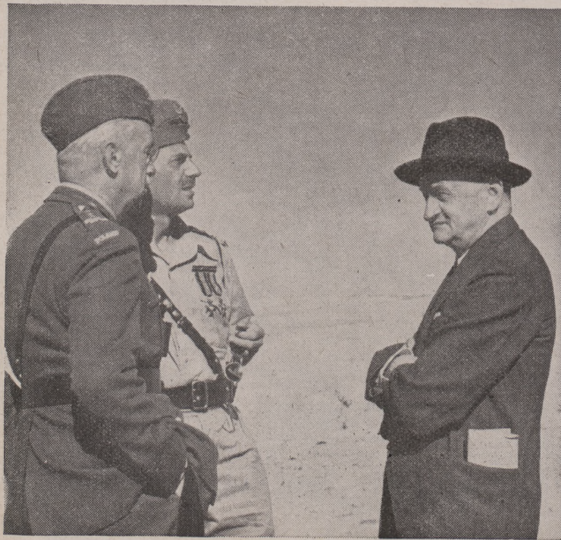
Naczelnny Wódz, Dowódca Armii Polskiej na Wschodzie i Członek Rządu, Minister Stanu dla Spraw Polskich na Bliskim Wschodzie