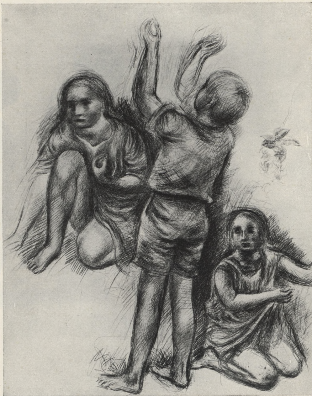
H. Huber (Sihlbrugg): Dzieci w ogrodzie owocowym