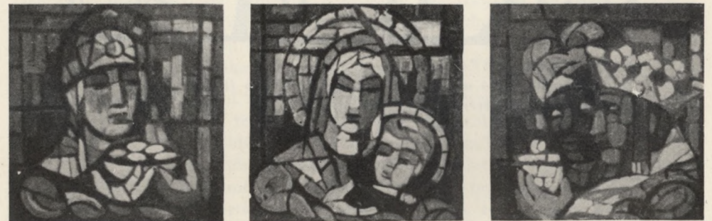
A. Cingria: Nativité