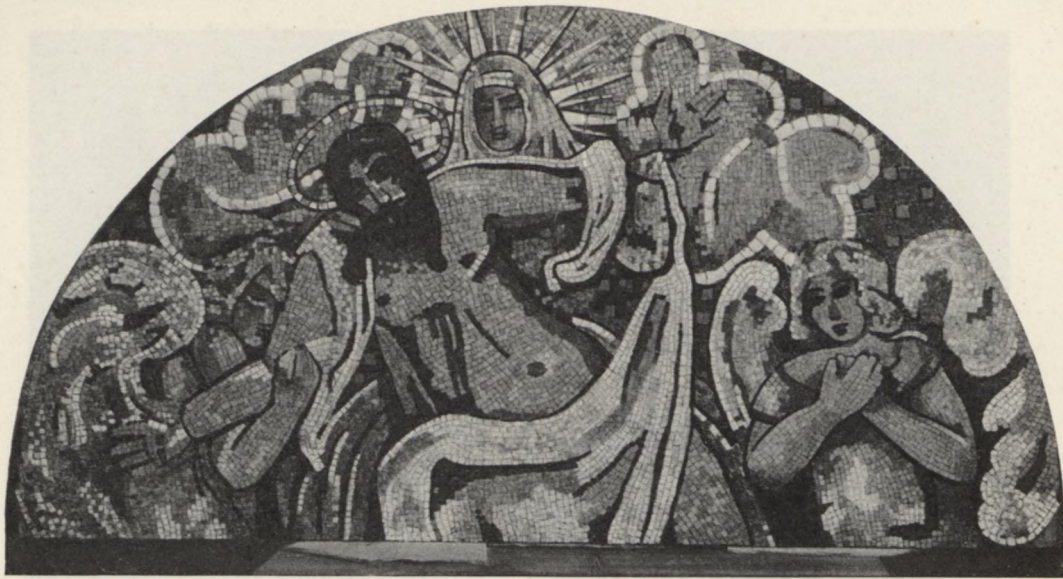
A. Cingria: Descente de la croix