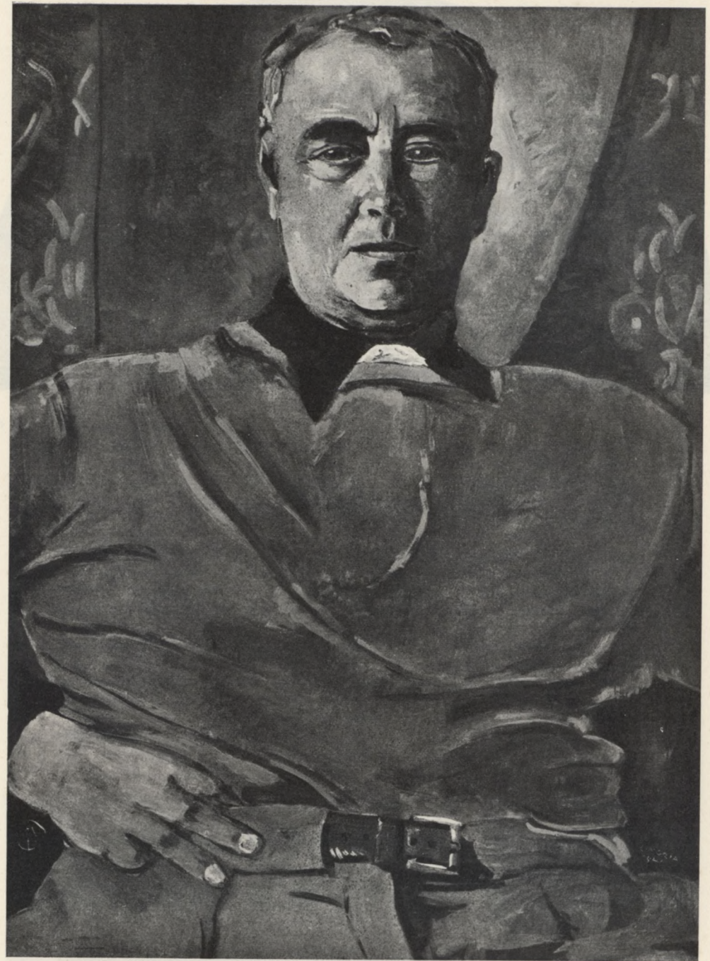
ALEKSANDER CINGRIA: Autoportret