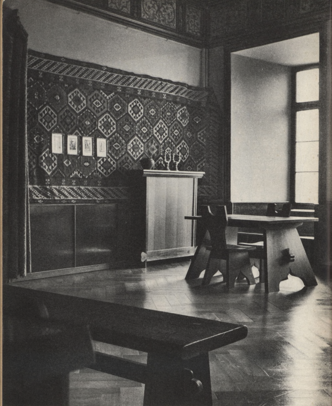
E. Lukas: Z teki rapperswilskiej

Aż naraz, któregoś popołudnia — bo nocą oni nie wazą się chodzić — zaroilo się we wsi od Niemców. Było ich z pół kompanii. Wyszli z lasu, z wszystkich naraz stron. Wieś bowiem niemal zewsząd otoczona była lasem. Stąd też jej nazwa Zalesie. Tylko od zachodu, którą wiodła droga do miasta, była otwarta. Gdyby nie ta wyrwa, byłaby to właściwie wielka polana leśna z kilkunastoma chałupami po środku.