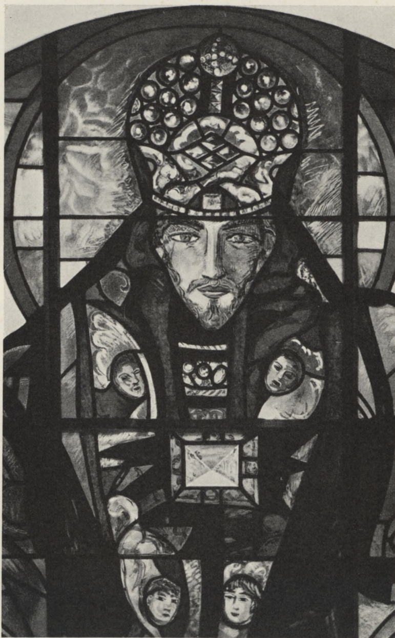
A. Cingria: Le Christ-Roi — Chrystus Król (Bulle)