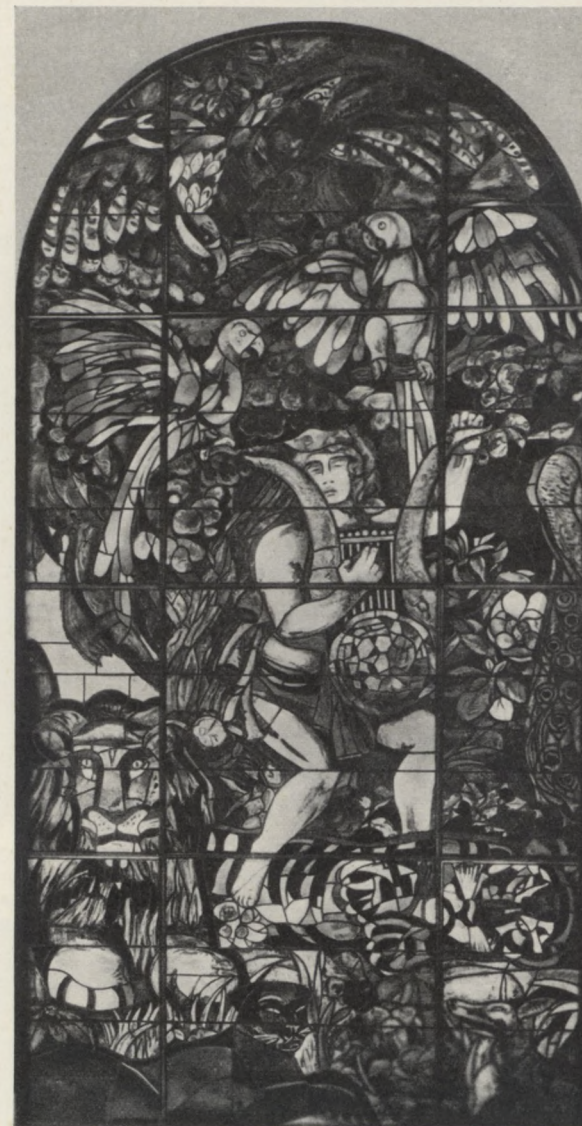
A. Cingria: Orphée (Orfeusz)