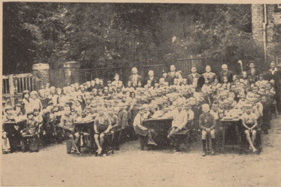
Dzieci półkolonii przy obiedzie.

Dzieci te przebywały na półkoloniach po 4 tygodnie.