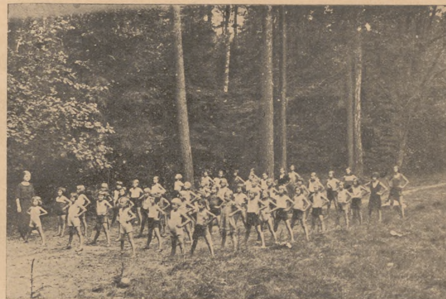
Dzieci kolonii przy gimnastyce porannej.

chłopców poprawił się wydatnie i wszyscy oni przybrali poważnie na wadze. Najwyższy przyrost na wadze wynosił 4,7 kg, najniższy — 0,4 kg. Łączny zaś przyrost na wadze wszystkich chłopców osiągnął 98,2 kg.