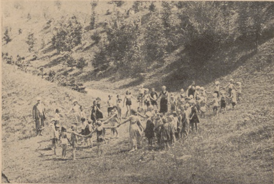
Dzieci kolonii bawią się na górze zamkowej.

W gazetce tej, o objętości 6 stron, omówiono szczegółowo wyniki i znaczenie urządzonych kolonii i półkolonii, tak z punktu widzenia zdrowotności młodzieży jak i społecznego. Gazetkę tę ilustrowaną licznymi fotografiami wręczono wszystkim pozostającym na kolonii chłopcom, a nadto rozpowszechniono ją w ilości 500 egzemplarzy.