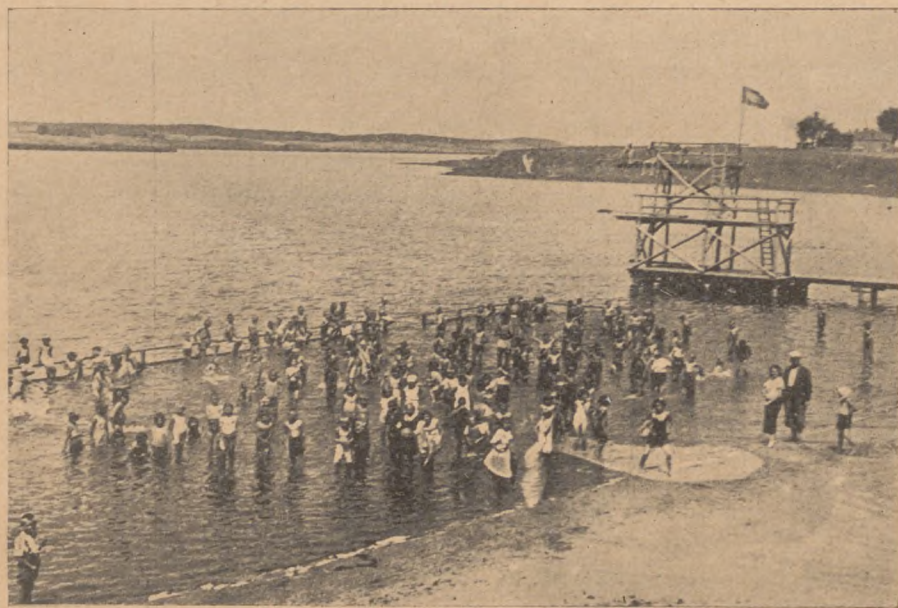
Kolonia mieściła się w pobliżu Jeziora Zamkowego, w którym dzieci często zażywały kąpiele.

W roku 1937 Ubezpieczalnia Społeczna prowadziła na szerszą skalę akcję kolonijną we własnym zakresie. W ciągu miesięcy lipca i sierpnia tego roku zorganizowała dwa turnusy kolonii letnich dla dzieci. W pierwszym turnusie, trwającym od 2—29 lipca wzięło udział 65 dziewczynek w wieku od lat 7—14. Dzieci rekrutowały się z Torunia, Chełmży i Wąbrzeźna, przeważnie gorzej sytuowanych rodziców, wątłe i niedostatecznie odżywione. Brak na wadze przeciętnie dla każdego dziecka wynosił 460 gramów. Po 4 tygodniach pobytu na kolonii przybytek na wadze wynosił od 0,4 do 1,8 kg, przeciętnie zaś na jedno dziecko 0,8 kg, tj. tyle, ile dziecko winno dobrać w normalnych warunkach rozwoju w ciągu pół roku