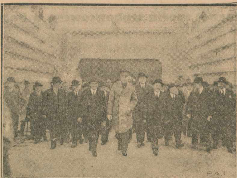
Przed kilku dniami odbyło się w obecności króla Belgów uroczyste otwarcie dwóch tuneli biegnących głęboko pod Skaldą i łączących Antwerpię z Tete de Flandre. Na zdjęciu naszym widzimy króla oraz jego otoczenie wychodzących z tunelu.