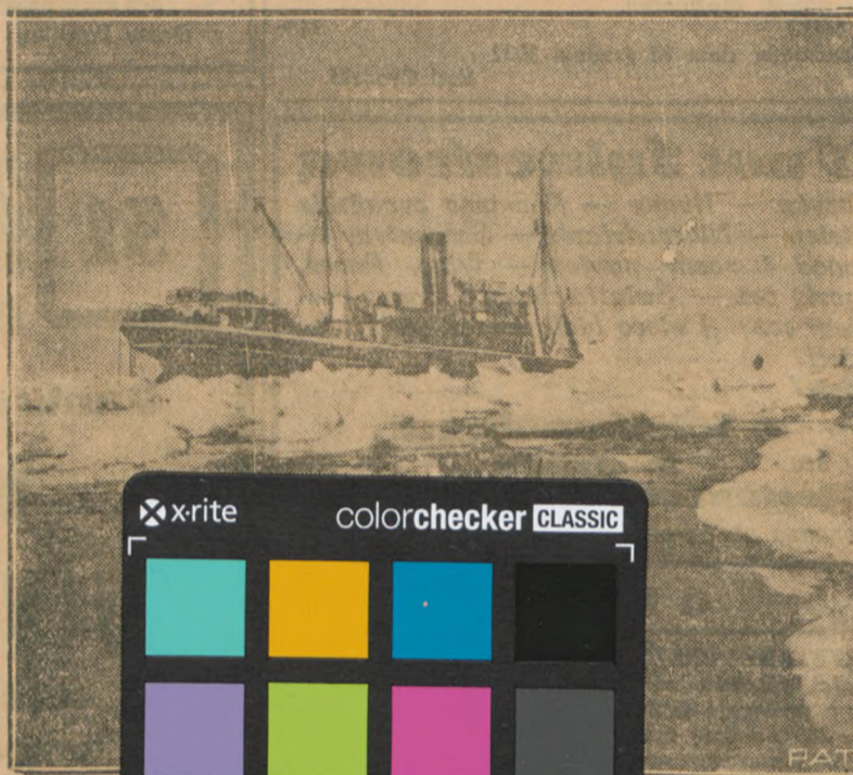
Najsilniejszą i najnowszą flotylę lodolamaczy tworzą polskie. Na zdjęciu naszym widzimy jeden z tych okrętów.