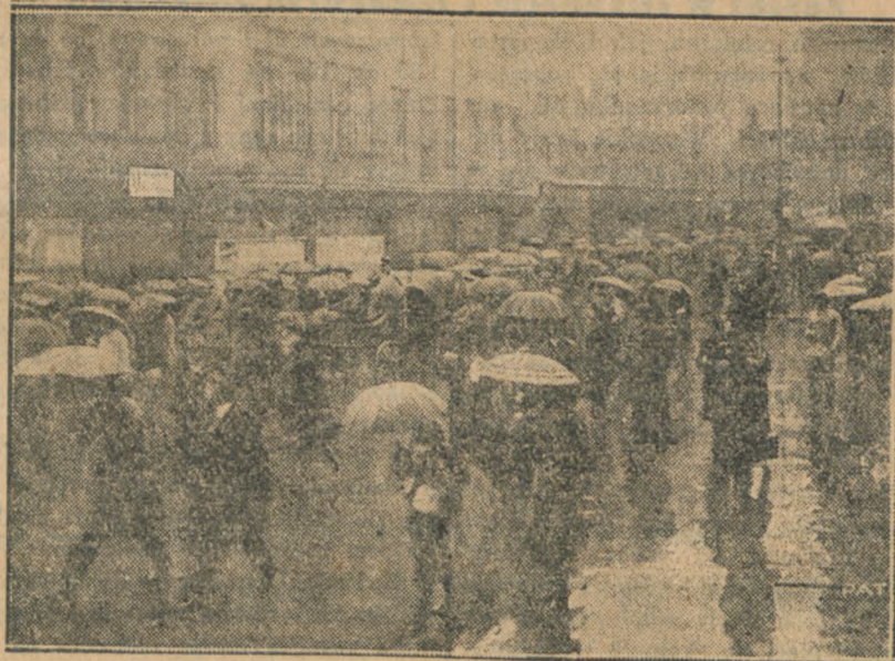
Od kilku dni trwa w Berlinie strajk służby tramwajowej i autobusowej. Strajkuje kilkadziesiąt tysięcy osób. Strajk ten daje się ogromnie we znaki Berlinowi, pozbawil bowiem wszelkiej komunikacji olbrzymią stolicę Rzeszy Niemieckiej. Na ilustracji naszej widzimy tłumy ludności, zdążające piechotą do dworców kolei miejskich, które jednak nie są w stanie podać potrzebom.