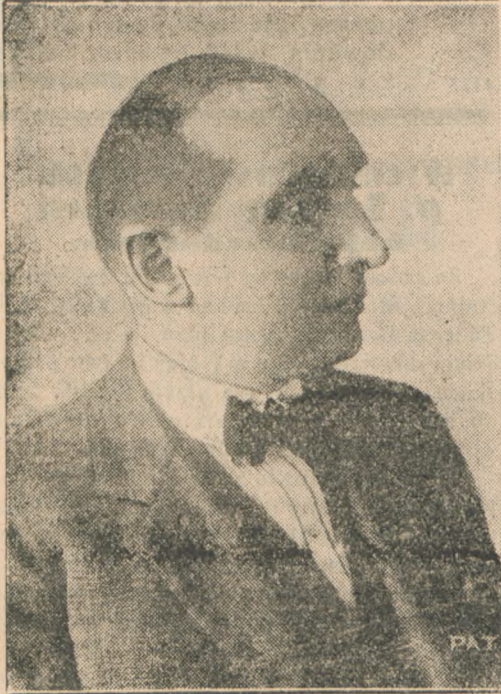
Długoletni minister spraw zagranicznych RP. p. August Zaleski ustąpił ze swego stanowiska, po przeszło sześciolatej pracy na tym posterunku.