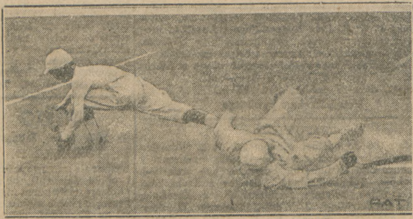
Base-ball, narodowa gra amerykańska zyskała po drugiej stronie Pacyfiku wielką popularność. Ilustracja nasza przedstawia moment zawodów o mistrzostwo szkół średnich w Japonii.