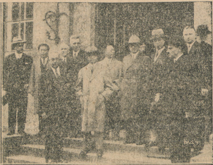
Na fotografii naszej widzimy gości chińskich po przybyciu do Warszawy.

Przemówienie powitalne wygłosił p. wice-