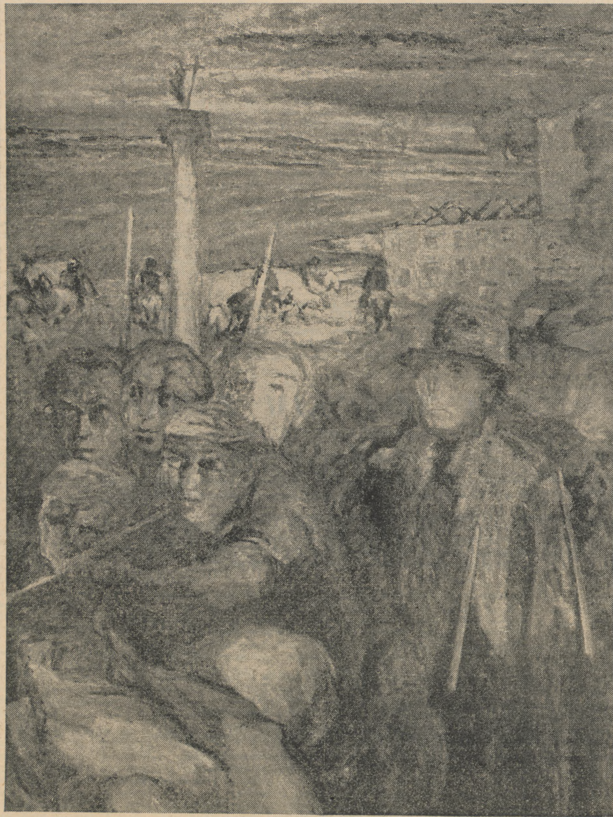
Henryk Gotlib: Warszawa (fragment)

Jest to pierwsza reprodukcja wielkiego obrazu (dziewięć metrów kwadratowych), skończonego niedawno i jeszcze nie wystawionego. Obraz ten powstał w Londynie i jest jednym z pierwszych dzieł plastycznych, natchnionych cierpieniem i bohaterstwem Warszawy. Na reprodukowanym wycinku poznajemy łatwo: łacę wiślaną, kolumnę Zygmunta, Zamek Królewski w ruinie, i na pierwszym planie żołnierza polskiego, oraz grupę ludzi walczących i zdjętych grozą wobec okropności tego, ce przeżywają. Autor tego obrazu należy do wybitnych malarzy współczesnych. Ma za sobą długą działalność artystyczną. Bezpośrednio po wojnie brał żywy udział w krakowskim ruchu, mającym na celu odnowienie sztuki plastycznej ("Formiści," "Niezależni"). Wystawiał od roku 1918 w kraju i zagranicą: we Francji, w Niemczech, Holandii, Belgii, Skandynawii ii. Uczestniczył w życiu organizacyjnym; przez dwa lata redagował "Głos Plastyków." Pisał wiele o sztuce. Przed wojną ukończył książkę: "Wedrówki malarza," obecnie przygotowuje dla wydawnictwa "Minerwa" angielską książkę: "Polish Painting" ("Malarstwo polskie").