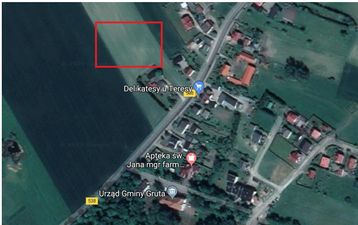
Oto miejsce poszukiwań samolotu.