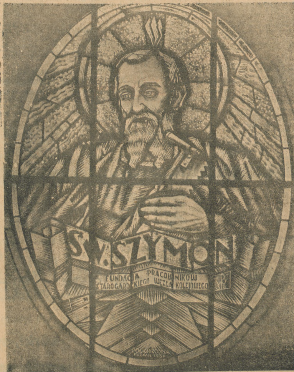
Witraż w kościele parafialnym św. Wojciecha w Starogardzie. — Praca art. malarza Podlaszewskiego.

Przypuszczać należy, iż w roku przyszłym zarówno uzdrowiska jak i sfery zainteresowane przystąpią do realizacji tej ze wszechmiar zasługującej na poparcie akcji.