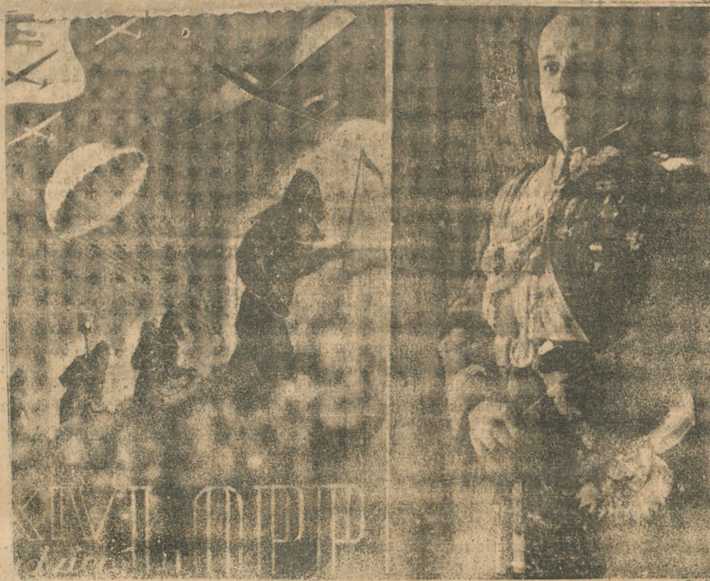
Afisz propagandowy na tydzień LOPP.

materiałną społeczeństwa, po prostu entuzjazm ofiarności i nikt nie ma prawa od obowiązku ofiarności tej się uchylać. Każdy na ten cel ofiarowany grosz tysiiąc razy się opłaci na wypadek wojny.