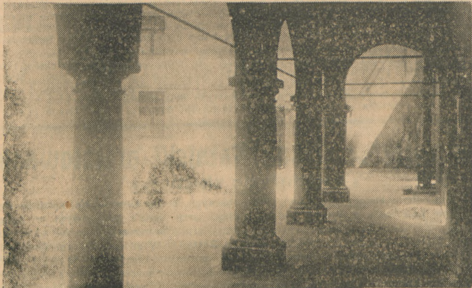
Co to i gdzie to?