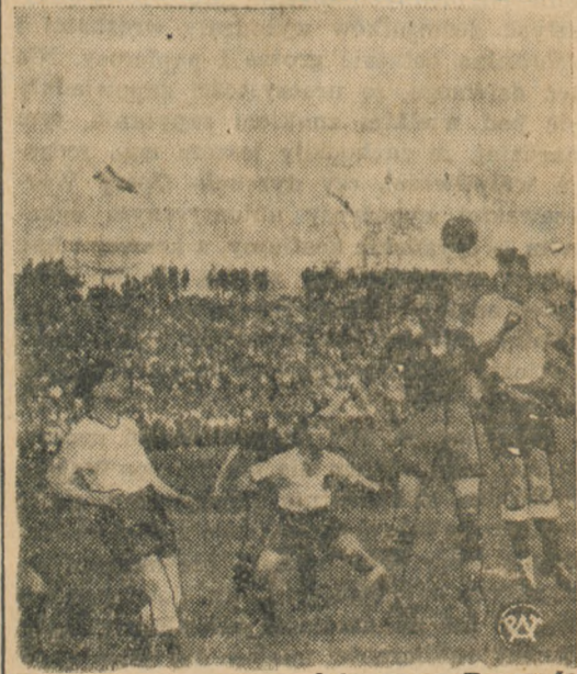
Fragment z meczu państwowego Rumunia — Polska, rozegranego w ub. niedzielę w Łodzi. Jak wiadomo Polacy ulegli Rumunom 4:2.