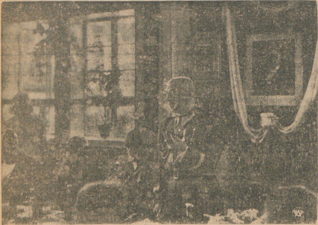
Moment z przemówienia Marsz. Śmigłego Rydza podczas przyjęcia w Liskowie.