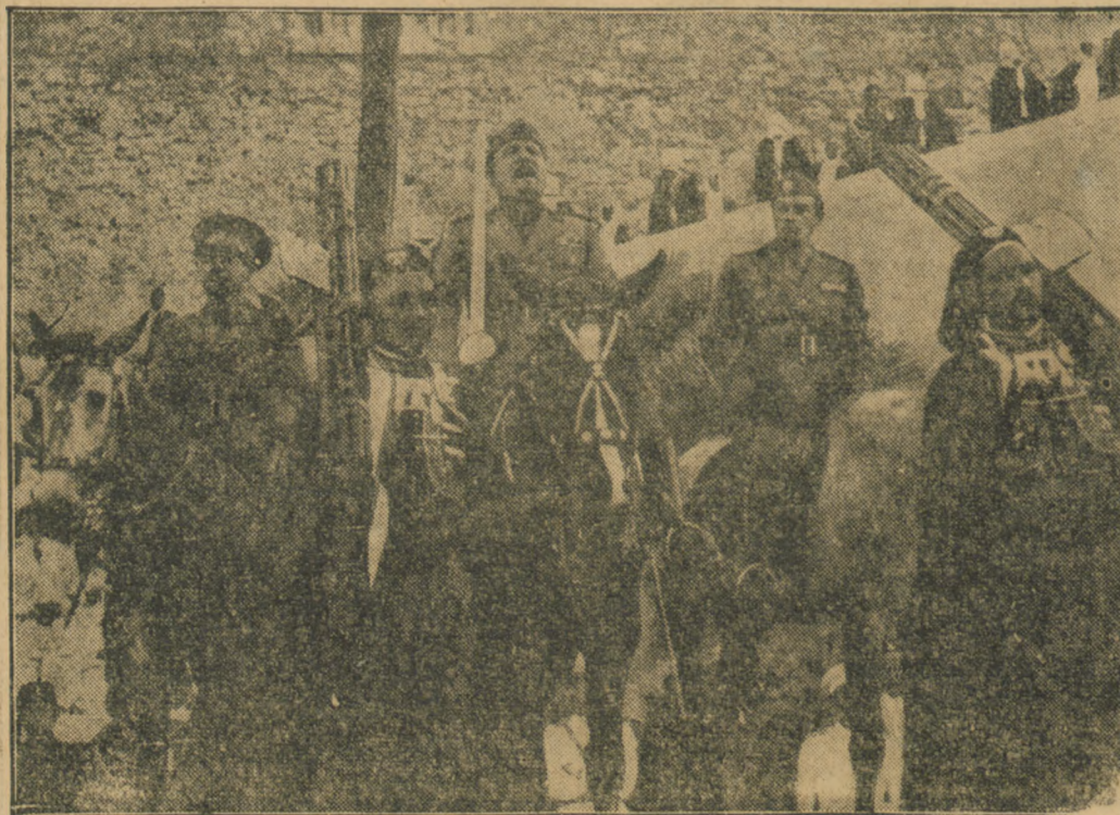
odbiera rewij wojsk tubylczych w Trypolisii, podczas której wygłosił przemówienie do naczelników szczebanów.

DZIECKO POLSKIE — W POLSKIEJ SZKOLE POPZYJ ZBIORKE NA SZKOŁY POLSKIE ZA GRANICĄ