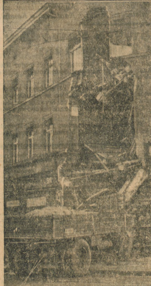
nego samochodu wraz z przyczepką, na której znajdowało się 300 ctn. zwier, najechał na narożnik domu. Samochód przebił front znajdującą się tam sklepu do głębokości 3 metrów i zламаł podporę narożnika. Cały narożnik 4-piętrowego domu zawalił się.