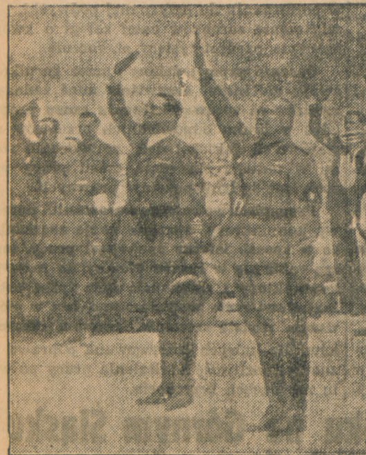
Po przybyciu do Libii Mussolini dokonał otwarcia pierwszej części wielkiej autostrady, która prowadzić będzie wzdłuż całego wybrzeża Libii.

Trypolis, 17. 3. (PAT). Dziś Mussolini dokonał tu otwarcia targów trypolitańskich. W czasie uroczystości nad terenem targów przelatywały eskadry samolotów w formacjach czwórkowych. Ze specjalnego miejsca Mussolini wygłosił przemówienie, w którym przypominał, iż w okresie od 1926 r., tj. od ostatniego jego pobytu w Libii nastąpiły pełne chwale wydarzenia. Dyrektywy Rzymu były mądre i metodyczne