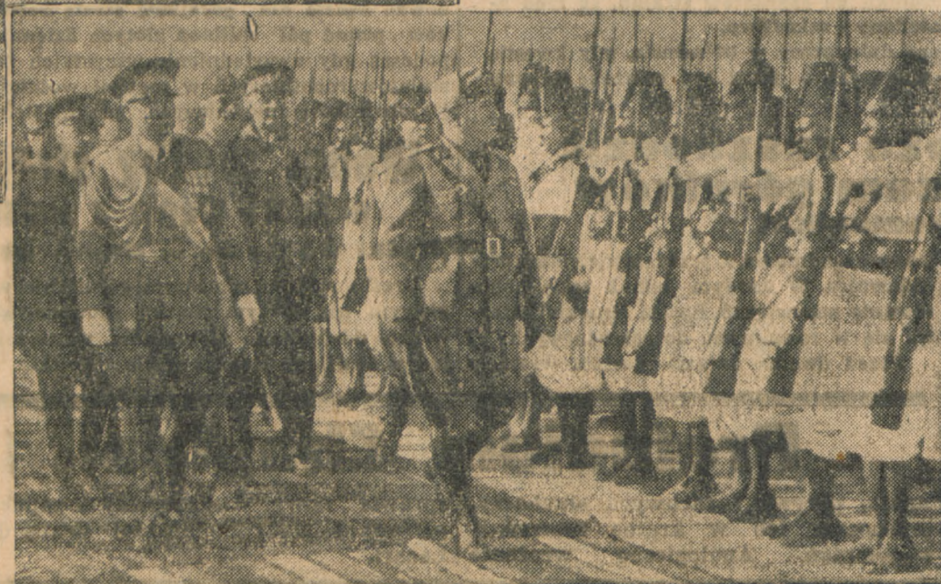
Mussolini w towarzystwie marszałka Balbo dokonuje przeglądu wojsk kolonialnych w Tobruk.

O tym, że woda jest pożywna, świadczy to, że człowiek o samej wodzie może żyć 30 dni, koń 25, kot 20, pies 30 dni, a żółw bez pokarmu i bez wody dołero po 2-3 latach umiera.