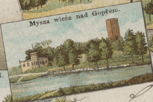
Mysza wieża nad Gopłem.

Zakład artystyczny C. Jacobsena, Altenburg S. A.