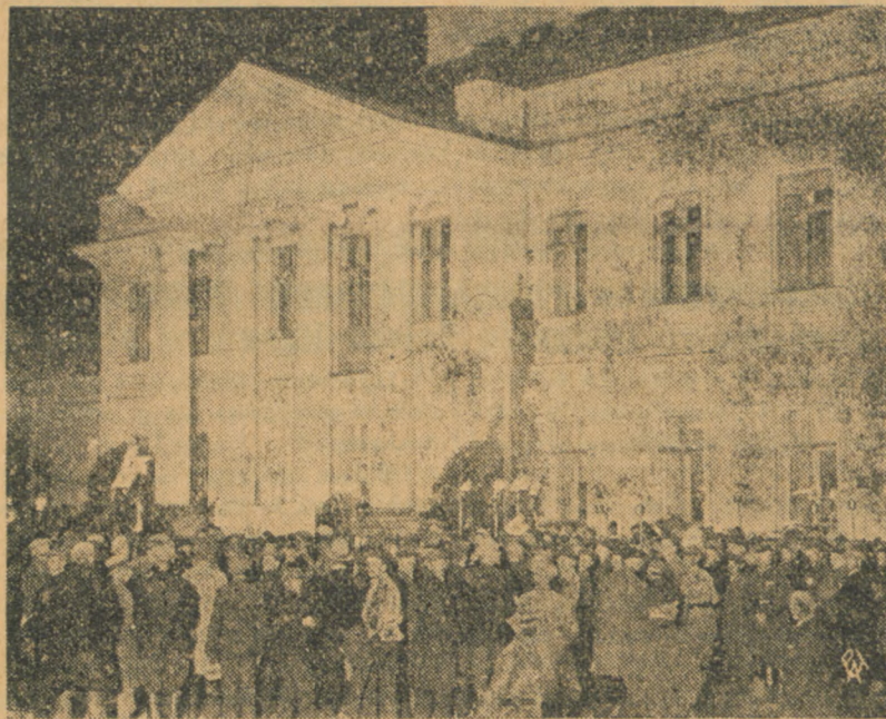
Dn. 5 bm. o godz. 7 wieczorem wycieczka włościan z Wileńszczyzny w liczbie tysiąca osób udała się z orkiestrą i pochodniami z ulicy Wiejskiej przez Aleje Ujazdowskie do Belwederu by złożyć hold Pierwszemu Marszałkowi Polski Józefowi Piłsudskiemu. — Zdjęcie przedstawia wycieczkę przed pałacem Belwederskim.