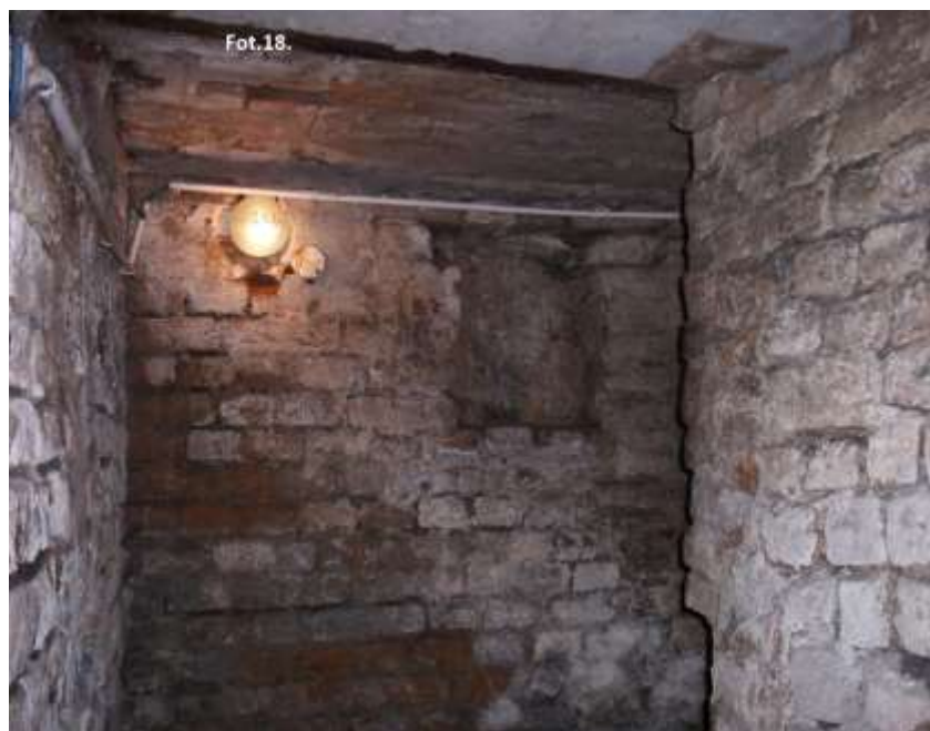
2. Fragment muru z 1 poł. XIII w. z wątkiem opus rusticum . Piwnica kamienicy przy ul. Murowej 24/Mickiewicza 3.