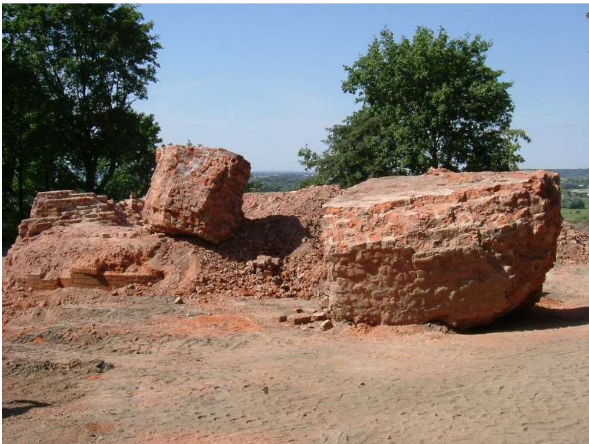
2. Odlamki z rumowiska wieży Klimek. Stan z 4.07.2006 r. Po prawej stronie odlamek z wiązaniem opus rusticum. Z lewej strony fragment wnęki oświetleniowej z wnętrza wieży.