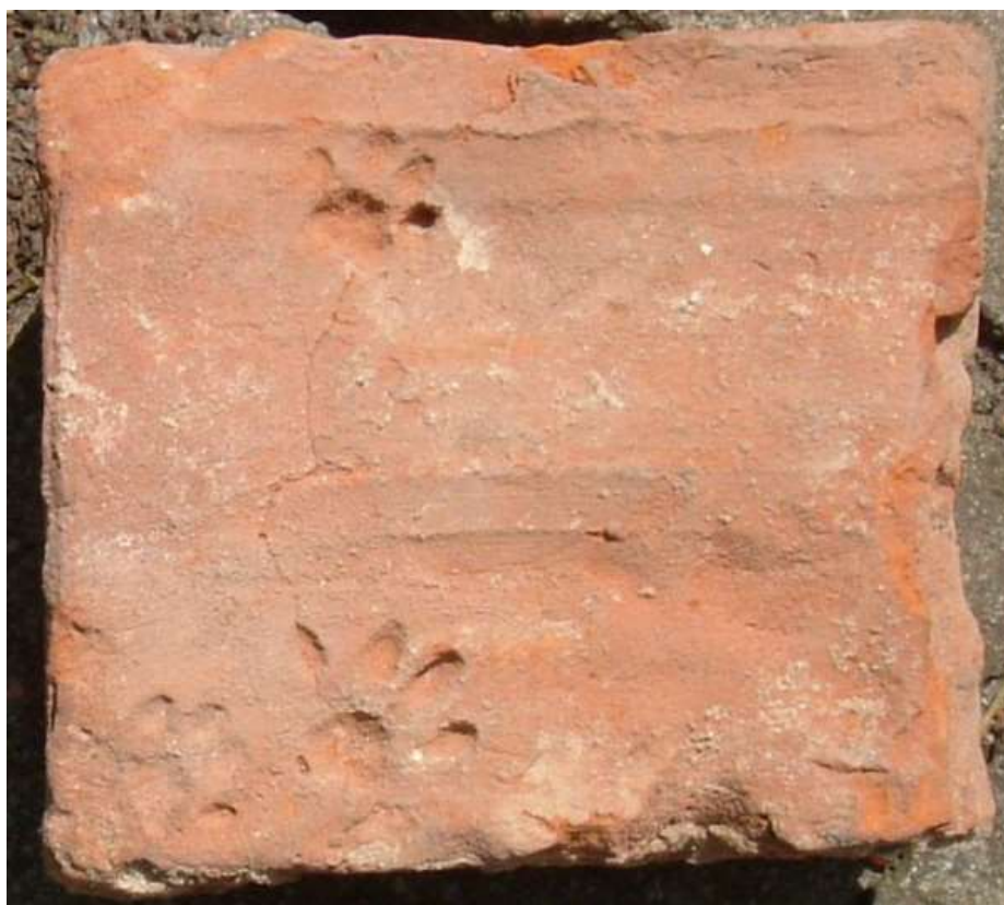
1. Romańska cegła z wieży Klimek. Stan z 4.07.2006 r.