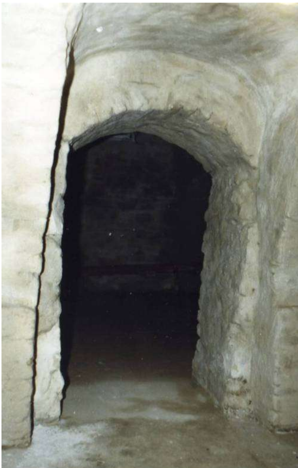
4. Dawna kaplica św. Michała Archaniola. Lata 20-30 XIII w. Obecnie piwnica kamienicy przy ul. Klasztornej 6. Stan w 1998 r. Wejście od strony północnej.