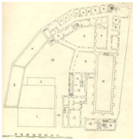
Ryc. 1. Klasztor Benedyktynek. Za J. Fryczem.

Wygląd kamienic mieszczańskich w Grudziądzu z okresu średniowiecza nie był przedmiotem badań naukowych, gdyż uznano, że się nie zachowały 1 . J. Frycz napisał także, iż wąskie i niskie, z reguły dwuokienne i dwukondygnacyjne kamieniczki tworzyły pejzaż architektoniczny Grudziądza, wzbogacony górującą sylwetą zamku, bardziej reprezentacyjną, większą w skali od małych domków mieszczańskich, architekturą ratusza i kościołów oraz dwukondygnacyjnych ale rozłożystych klasztorów 2 . Wg X. Froelicha domy były kryte dachówką. Kamienice bogatych mieszczan liczyły trzy okna szerokości i miały trzy kondygnacje. Prawie wszystkie miały szczyty. Domy rozdzielaly rynny. Nieraz brama wjazdowa zajmowała miejsce drzwi i okien. Często budy drewniane, mieszczące sklepy i warsztaty rzemieślnicze, zasłaniały domy na całej ich szerokości. Gdy się minęło te pomieszczenia i ciemne drzwi wiodące do domu, wchodziło się do dużej sieni, która sięgała do końca pierwszego piętra i była oświetlona jego oknami. Pokoje mieszkalne i sypialne były w tylnej części, z oknami na podwórze. Na parterze była jadalnia, pokój gościnny i do interesów. Na pierwszym piętrze były pokoje luksusowe 3 .