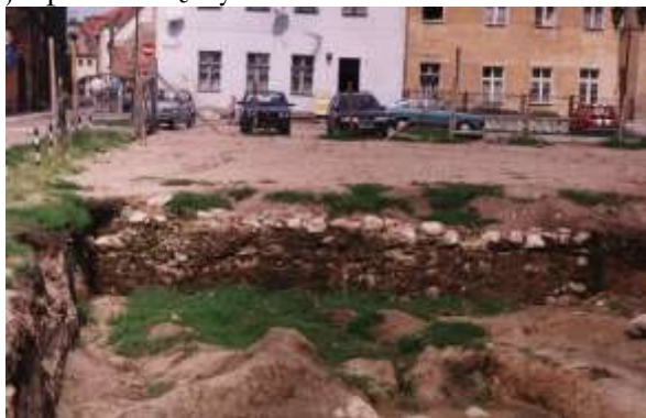
Ryc. 6. Wykop archeologiczny na terenie placu u zbiegu ulic Spichrzowej i Wodnej w 2001 r.

Na ścianie północnej, w murze kamiennym, na wysokości 0,57 m powyżej poziomu piwnicy, zachował się fragment drewnianego legara od podłogi o przekroju prostokątnym 11 cm x 12 cm. Przed remontem piwnicy posadzka z XIX w. wraz