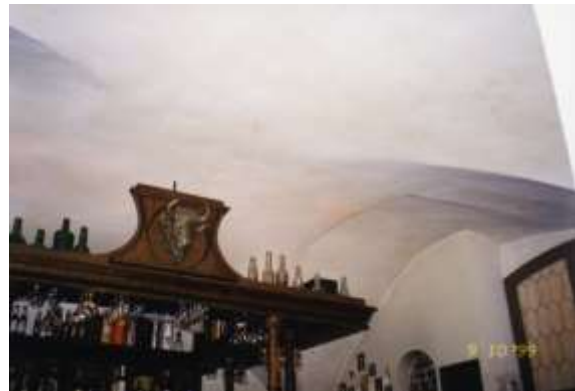
Ryc. 4. Sklepienie krzyżowe w części mieszkalnej.

Po remoncie piwnicy w 2000 r. przewód kominowy został zamurowany. Obecnie jest tu przejście między salami lokalu. O pierwotnym przeznaczeniu trzeciego pomieszczenia jako stajni lub owczarni świadczyły przymocowane do wnęk łańcuchy 11 .