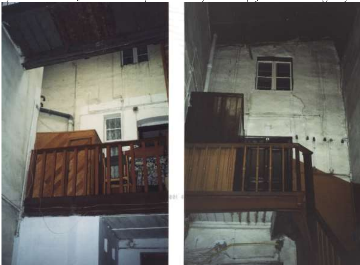
Ryc. 5. Kamienica przy ul. Starej 23. Kantor kupiecki, ściany wschodnia i zachodnia.

Kolejny typ reprezentuje kamienica u zbiegu ul. Podgórnej i Starej 23. Dawniej był to teren za Bramą Kwidzyńską. Kamienica ta posiada wielką sień na wysokości pierwszego piętra, zajmująca dużą część domu od strony ul. Podgórnej, (ryc. 5). Natomiast część mieszkalna jest od strony ul. Starej. Jest to układ zgodny ze