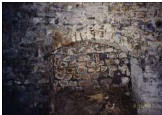
Ryc. 7. Piwnica.

O braku solidnej zabudowy w części zachodniej miasta, zgodnie z treścią planu katastralnego z 1772 r., który nie ujmuje tam kamienic mieszczańskich, świadczy wykop archeologiczny z 2000 r. W trakcie wykopu nie natrafiono na fundamenty domu, jakie występują w części wschodniej. Świadczą one, że były tu domy lżejszej konstrukcji, typu szkieletowego lub drewniane, zob. zdj. poniżej. Mogła tu mieszkać ludność służebna wobec klasztoru lub były tu zabudowania gospodarcze, (ryc. 7).