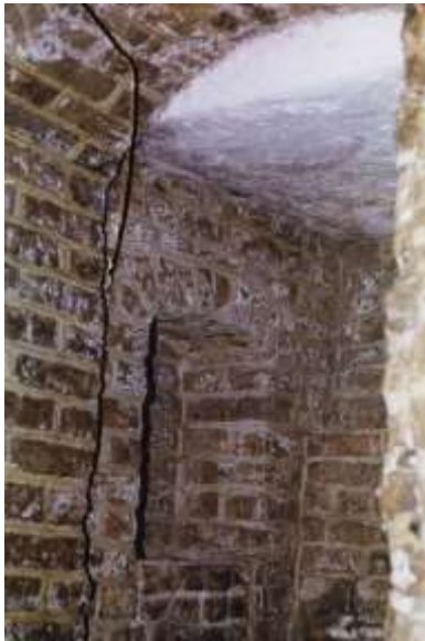
Ryc. 3. Piwnica kamienicy przy Rynku 20.

Kolejne kamienice reprezentatywne są przy ul. Wieżowej 2 / Rynku 16. Tam również, jak w przypadku Rynku 20, stanowiły one pierwotnie jedną całość a ich piwnica była parterem w średniowieczu. Była to, idąc za leksykonem W. Kocha 10 , kamienica mieszczanina – rolnika. Na podstawie zachowanej piwnicy (dawnego parteru) można powiedzieć skrótowo, że składała się ona z trzech równoległych części: mieszkalnej o sklepieniu krzyżowym, (ryc.4).