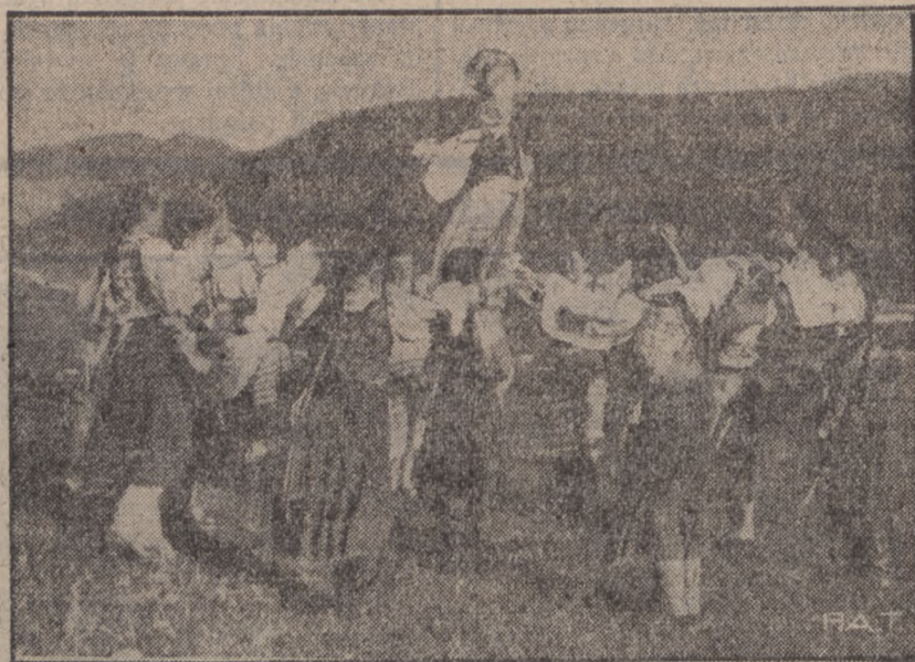
W dniach poprzedzających Święta Wielkanocne na całej Słowaczuźnie odbywają się rozmaite tradycyjne obchody ludowe, pochodzące jeszcze z czasów pogańskich. Na zdjęciu naszym widzimy jeden z takich obchodów, a mianowicie taniec ludowy około chochoła „Moranu”, przedstawiającego boginię śmierci. Uczestniczki tańca po jego zakończeniu wzuwają chochoła do wody. Obchód ten oznajmia końiec zimy a początek wiosny.