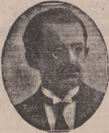
Zdjęcie nasze przedstawia prof. Leona Kozłowski mianowanego w dniu dzisiejszym przez Pana Prezydenta Rzplitej podsekretarzem Stanu w Ministerstwie Skarbu