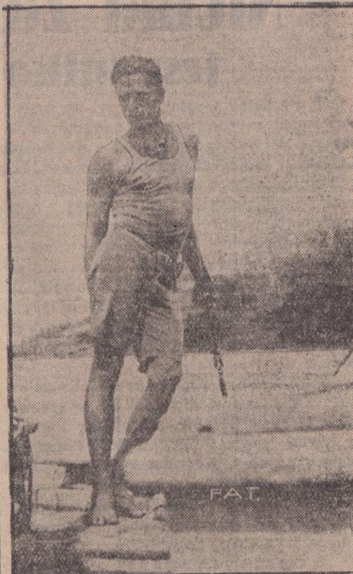
Na ilustracji naszej widzimy polawiacza perel z Queenslandu w Australji. Największą przyszkodą i niebezpieczeństwem w pracy polawiaczy perel stanowią rekiny, które w tych okolicach uwijają się całymi stadami. Polawiacze perel, słynący z niesłychanej odwagi, niejednokrotnie steczają krwawe walki z temi potworami, z których przeważnie wychodzą zwycięsko.