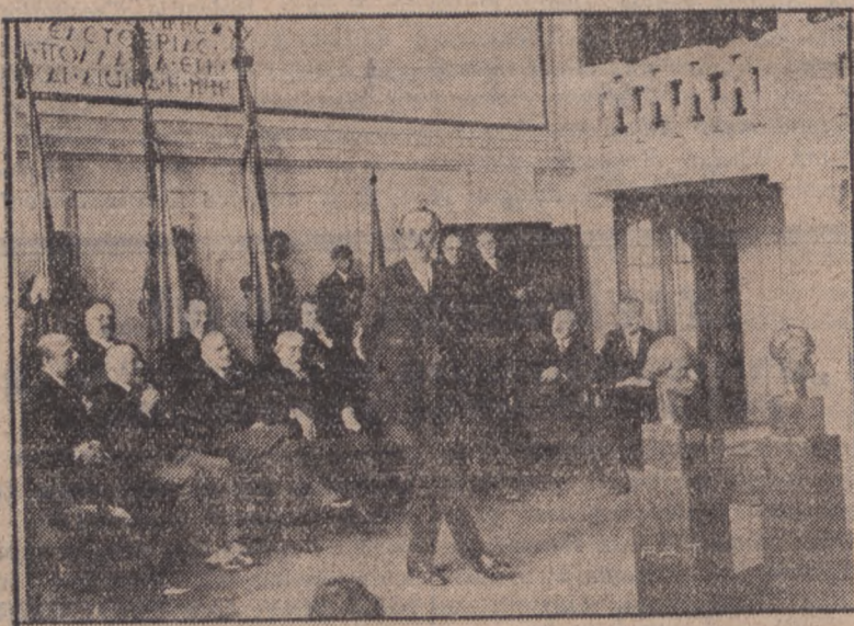
W uniwersytecie brukselskim odbyła się uroczysta podobna pierwszych zdobywców stratosfery. W tle widoczne są rzeźby prof. Piccarda i inż. Kipfera.