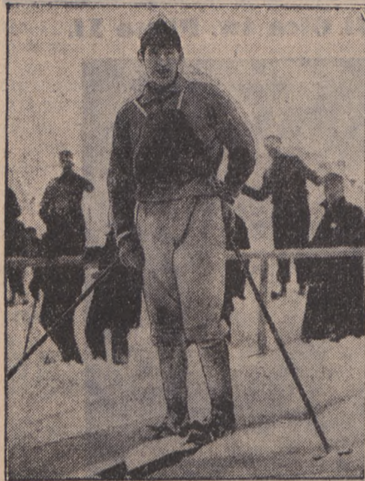
Groettumbrasen (Norwegja) mimo swych 34 lat odniósł ponownie zwycięstwo w kombinowanym biegu narciarskim.