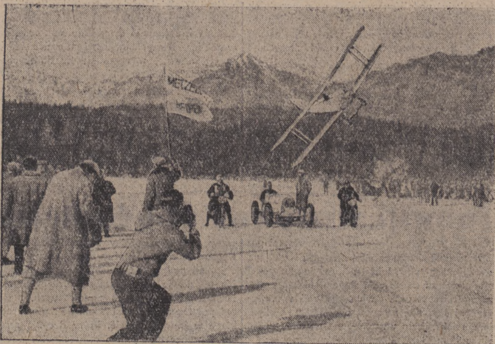
W Szwajcarii odbył się onegdaj tradycyjny wyścig między samochodem, motocyklem i samolotem. Przyczem awionetka biorąca udział w wyścigu, leciała z trawami nisko nad jeziorem alpejskim.