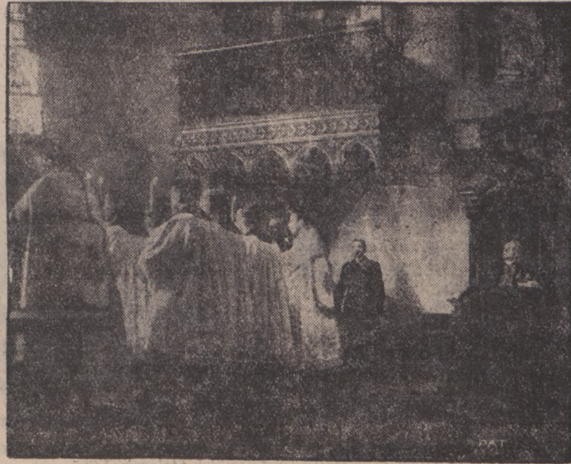
Na zdjęciu drugiem podajemy fragment z uroczystego nabożeństwa w katedrze św. Jana w Warszawie. Na zdjęciu tem na prawo obok grona kapłanów widzimy p. Prezydenta R. P. (X), dalej na prawo nuncjusza Apostolskiego w Warszawie (XX).