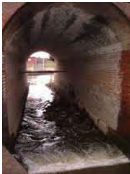
Ujście Rowu Hermana