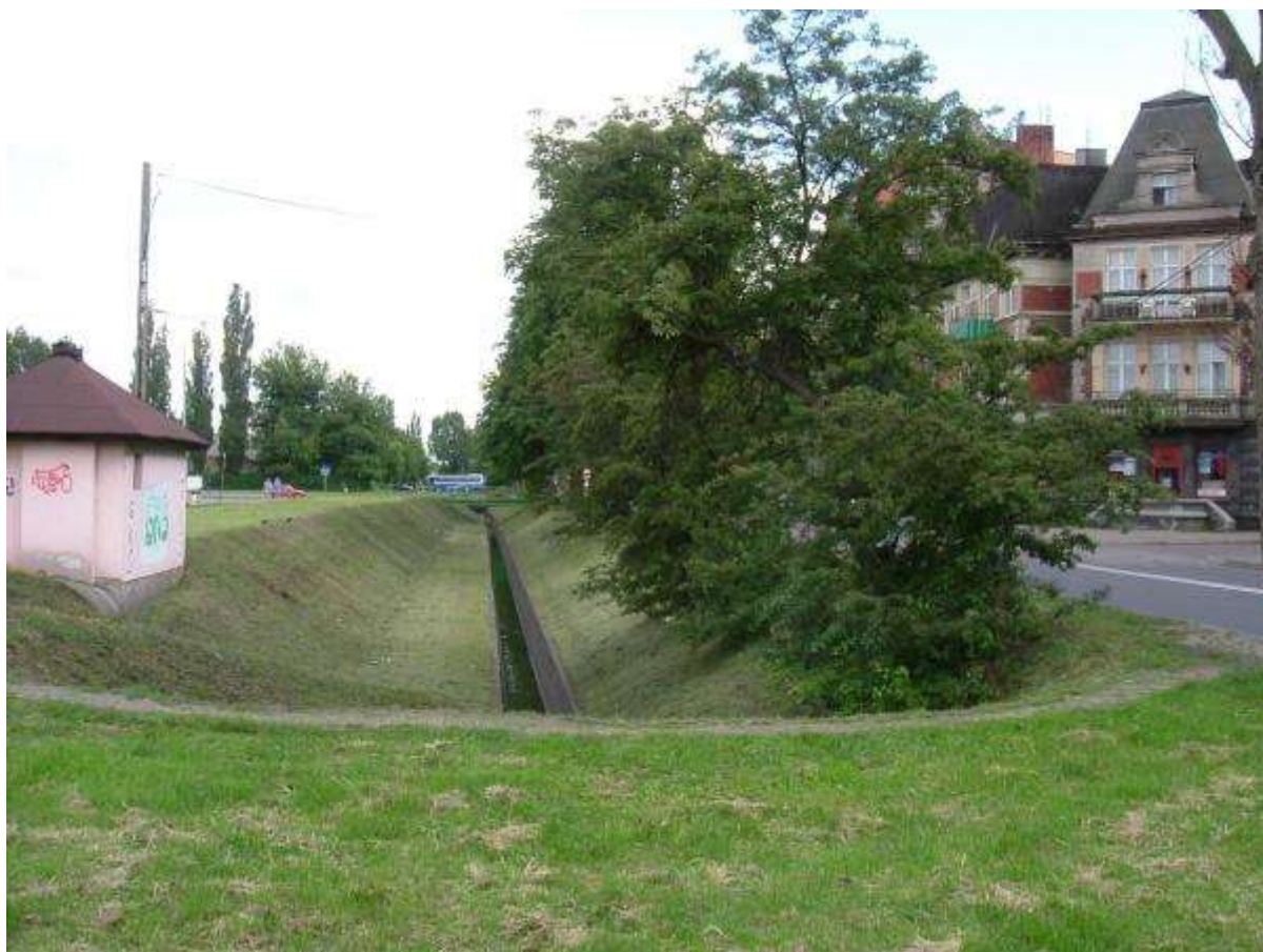
Rów Hermana z 1386 r. widok w kierunku wschodnim