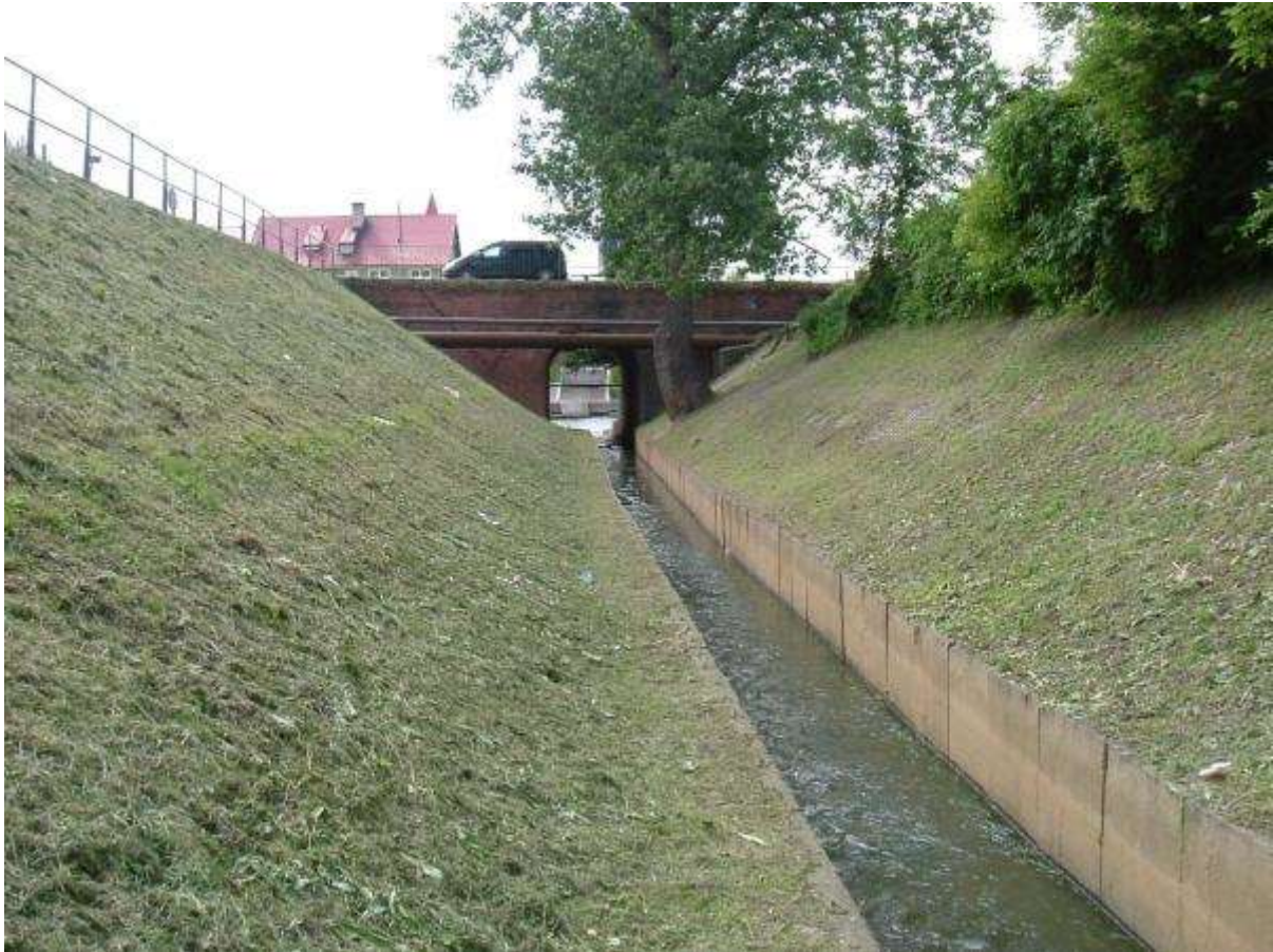
Ujście Rowu Hermana