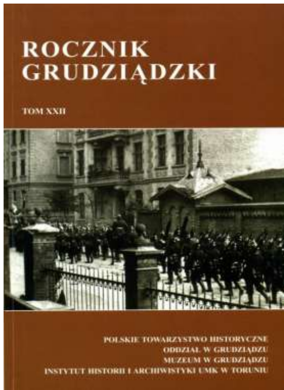
Okładka Rocznika Grudziądzkiego, tom XXII

Wydawnictwo „Rocznik Grudziądzki”, którego tom XXII (2014) właśnie się ukazał jest jedynym czasopismem naukowym, które spełnia rolę nie do przecenienia mobilizując autorów do badań nad przeszłością Grudziądza, opracowaniem źródeł itp. Wysokie wymagania formalne w stosunku do autorów artykułów zapewniają rzetelność badań. Wydawnictwo umożliwia także debiut naukowy młodym historykom spoza środowiska uniwersyteckiego. Tradycyjnie postarano się, aby zawartość „Rocznika Grudziądzkiego” była możliwie urozmaicona. W części „Artykuły” znalazły się dwa artykuły stricte archeologiczne.