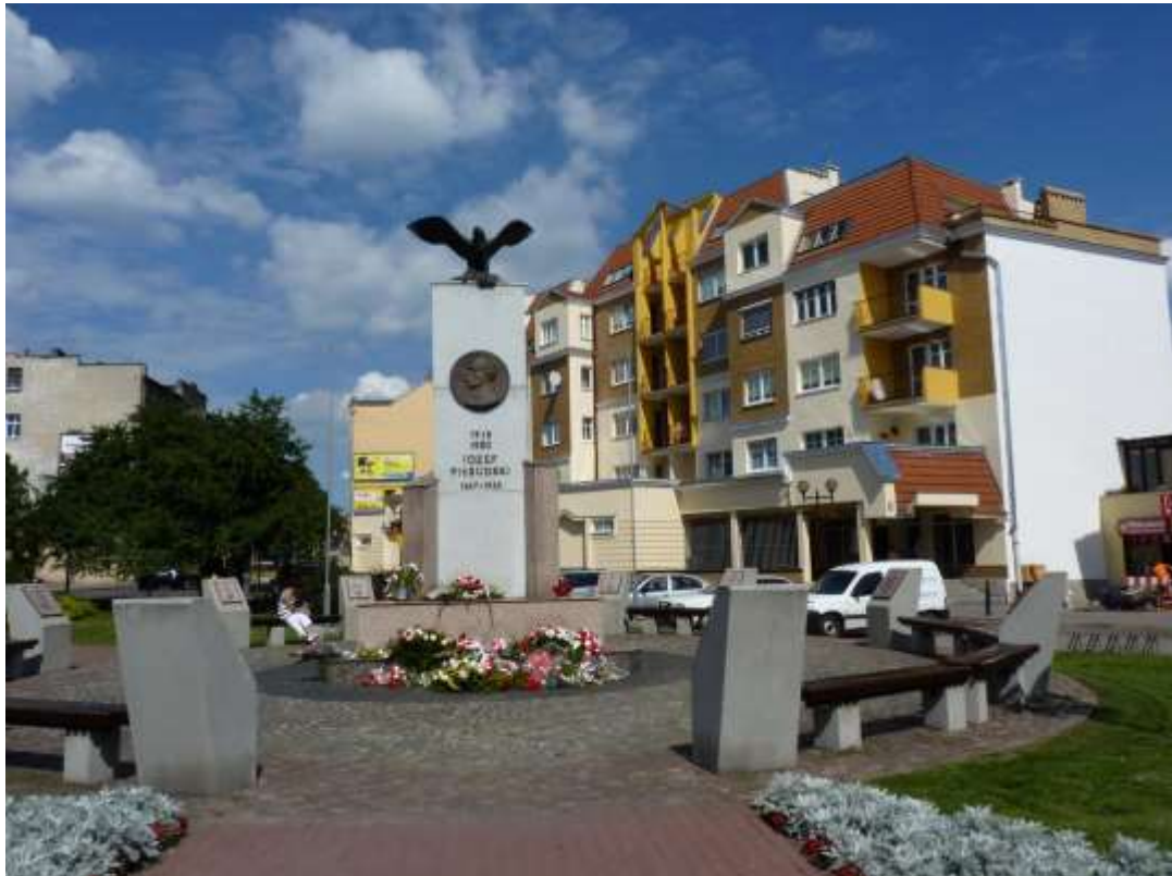
Pomnik Józefa Piłsudskiego w Grudziądzu.