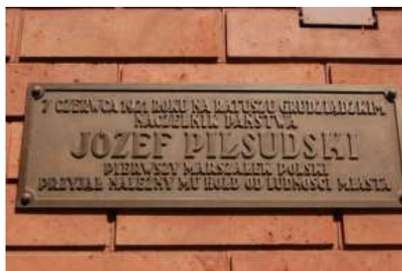
Tablica upamiętniająca pobyt J. Piłsudskiego w Grudziądzu na budynku ratusza.