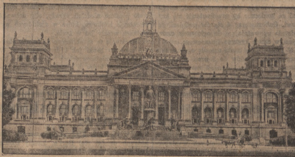
Spalony gmach parlamentu niemieckiego.

Berlin 1. 3. (PAT). W dniu wczorajszym policja obsadziła wszystkie gmachy rządowe oraz zakłady użyteczności publicznej m. in. gazownię, elektrownię i wodociągi miejskie. W celu ochrony torów, mostów i obiektów kolejowych zmobilizowano również straż kolejową