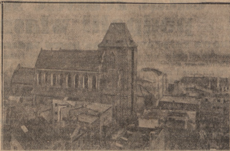
Toruń, stolica województwa pomorskiego, jest jednym z niewielu miast polskich, posiadających mnóstwo zabytków budowlanych, pochodzących z czasów średniowiecza. Do najpiękniejszych tego rodzaju zabytków należy kościół św. Jana. Na zdjęciu naszym widzimy ten kościół oglądany z okien ratusza.