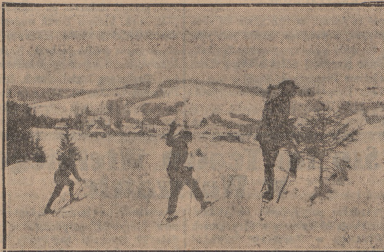
Korzystając z obfitych opadów śnieżnych oddziały Strzelców Podhalańskich wyruszyły w okolice góry na ćwiczenia narciarskie. Na zdjęciu naszym widzimy kilku Strzelców, ćwiczących się w jeździe na nartach.