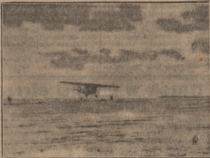
Ostatnio odbyły się pod Lublinem 3 lubelsko-podlaskie zimowe zawody lotnicze, przy udziale kilkunastu aparatów. Na zdjęciu naszym widzimy aparat RWD 5 pilotowany przez kpt. Haleskiego.