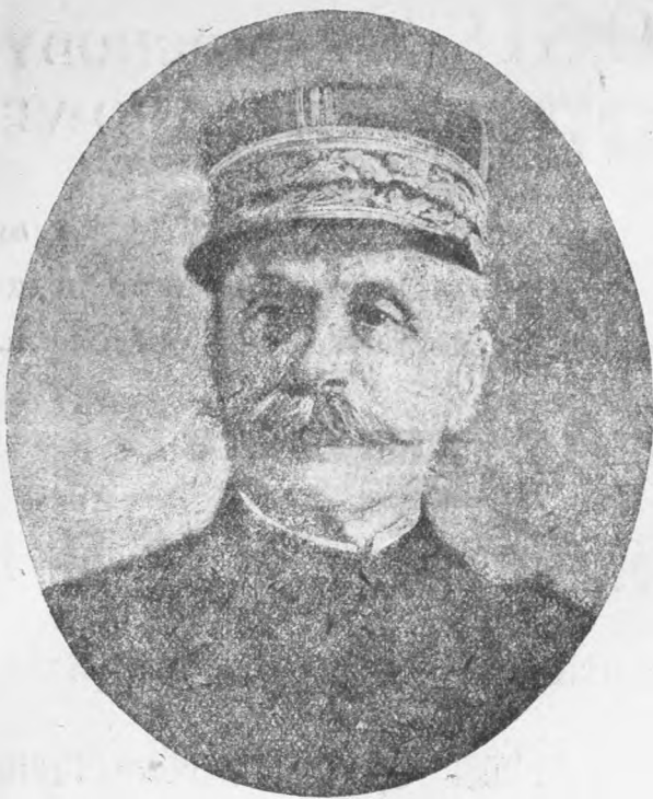
FERDYNAND FOCH, MARSZAŁEK POLSKI.