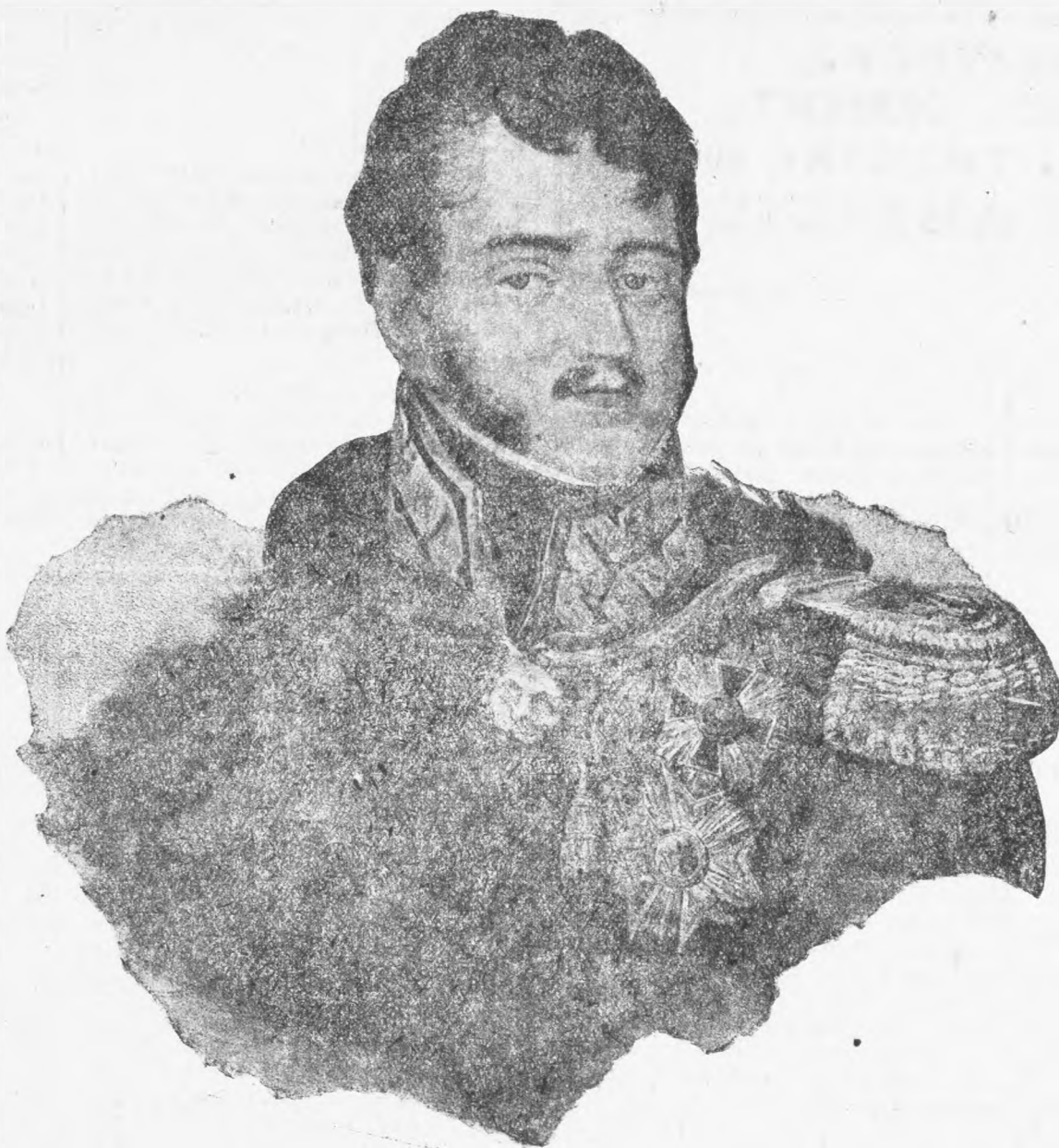
KSIĄŻĘ JÓZEF PONIATOWSKI, MARSZAŁEK FRANCJI.

Dla nas, dla Polski, umiejacej podziwiać rycerskie czyny, Foch jest miłym gościem. Pamiętamy Mu, iż dzięki Jego oporowi nie utracono całego szeregu zadań delegacji polskiej na Kongresie Wersalskim, pamiętamy przysłać nie jen. Weyganda — współ-