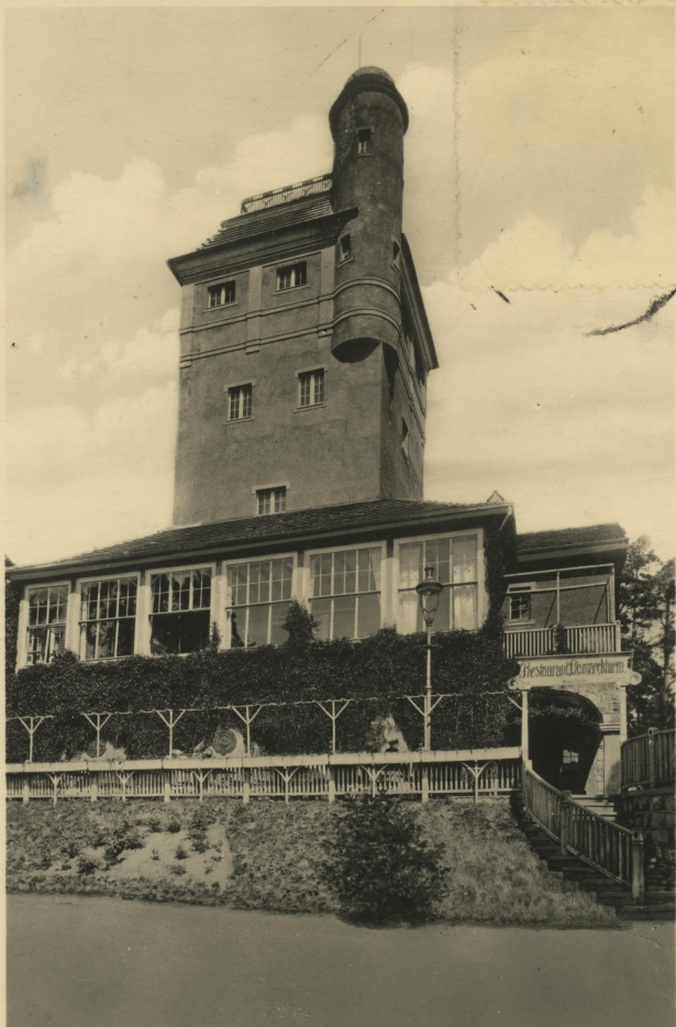
Lauenburg i. Pom., Bismarckturm,