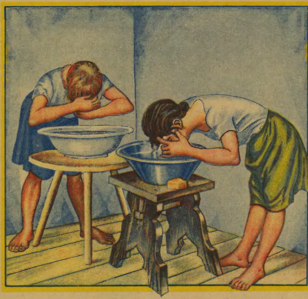
Używanie czystej wody i zawsze oddzielnej miednicy.