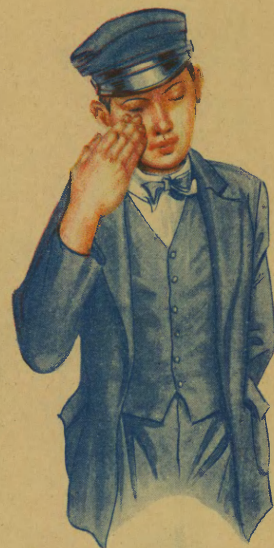
Zakażamy się jaglicą przez dotyknięcie i pocieranie własnych oczu brudnymi rękami, na których znajdują się zarazki jaglicy.

JAGLICA, zwana także EGIPSKIM ZAPALENIEM OCZU, jest chorobą, która powoduje upośledzenie wzroku i często doprowadza do SLEPOTY i KALECTWA. Jaglica jest chorobą ZAKAŻNĄ: bardzo łatwo udziela się otoczeniu chorego wskutek przeniesienia do oczu zarazków. Zarazki jaglicy znajdują się w łzach i wydzielinie oczu osób chorych na jaglicę. ZARAŻAMY SIĘ JAGLICĄ przez dotyknięcie oczu zakażonymi rękami lub przedmiotami.