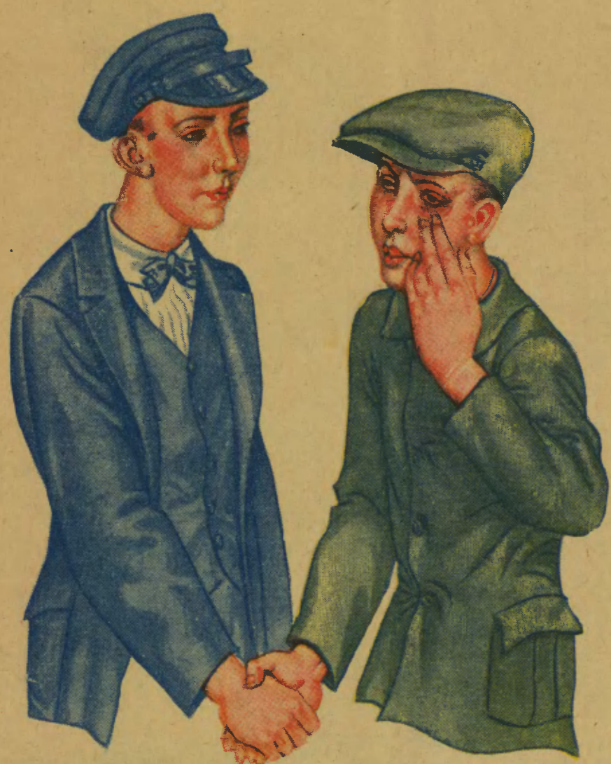
Zanieczyszczamy sobie ręce zarazkami jaglicy przez dotyknięcie twarzy i okolic oczu osoby chorej lub przy podawaniu ręki.

JAGLICA, zwana także EGIPSKIM ZAPALENIEM OCZU, jest chorobą, która powoduje upośledzenie wzroku i często doprowadza do SLEPOTY i KALECTWA. Jaglica jest chorobą ZAKAŻNĄ: bardzo łatwo udziela się otoczeniu chorego wskutek przeniesienia do oczu zarazków. Zarazki jaglicy znajdują się w łzach i wydzielinie oczu osób chorych na jaglicę. ZARAŻAMY SIĘ JAGLICĄ przez dotyknięcie oczu zakażonymi rękami lub przedmiotami.