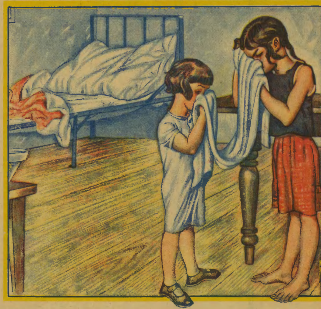
Używanie wspólnego ręcznika oraz sypianie na wspólnej pościeli z chorym na jaglicę.