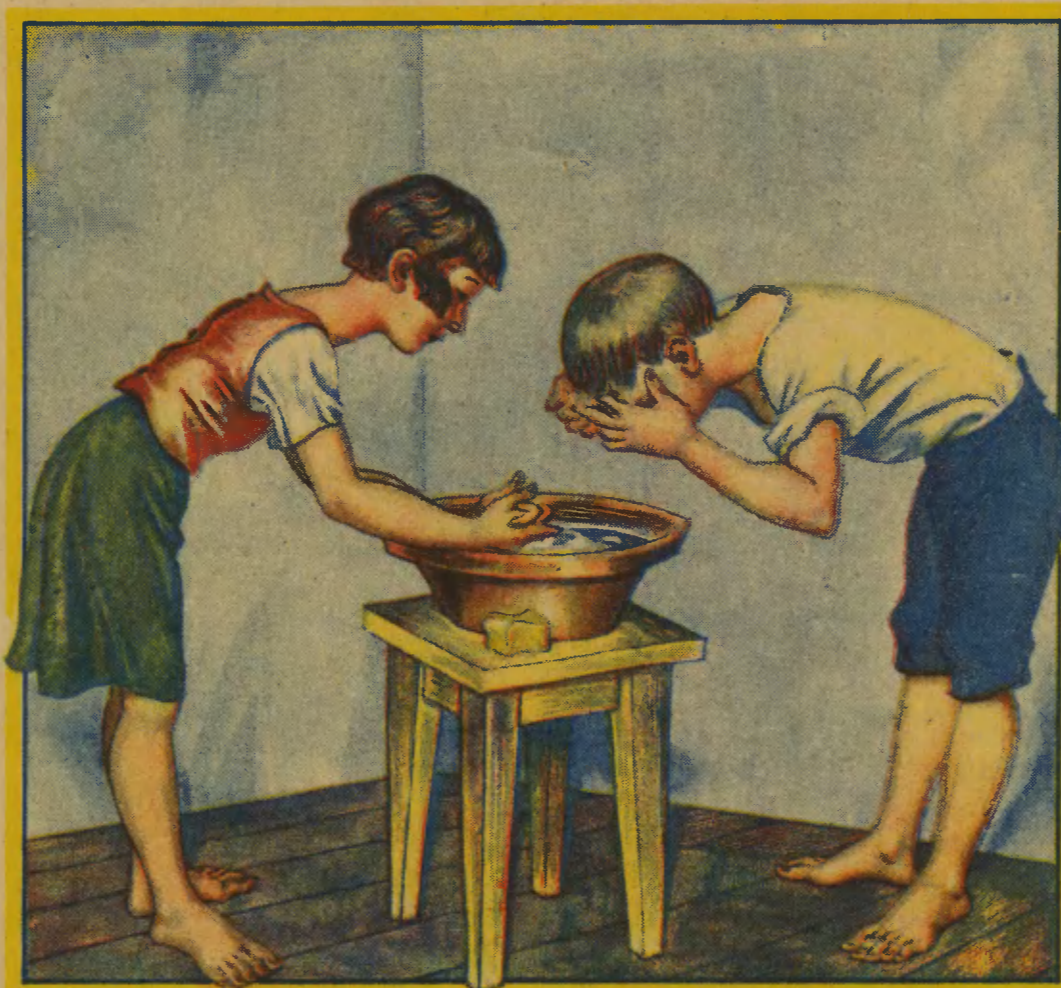
Używanie wspólnej miednicy z chorym na jaglicę.