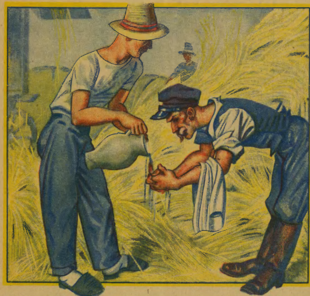
Częste mycie rąk, zwłaszcza przy pracy.