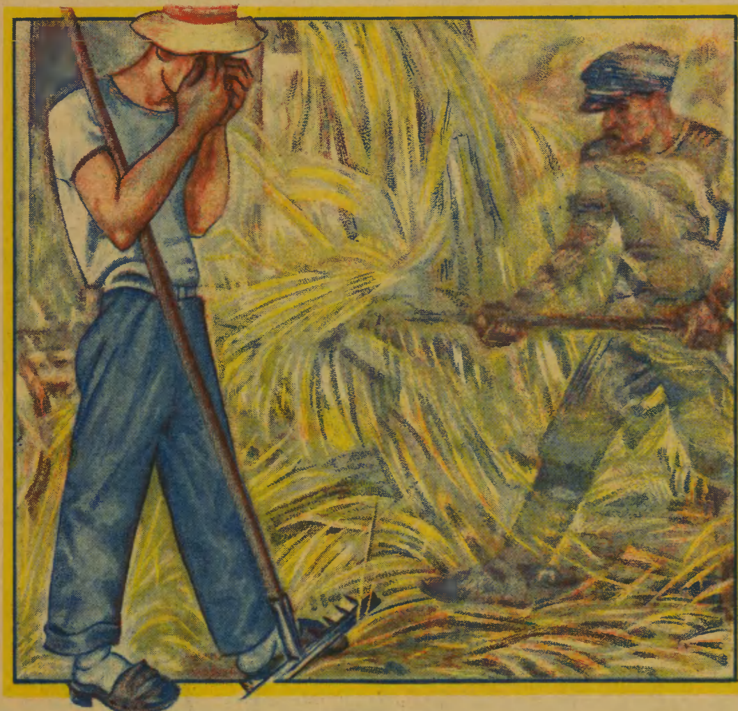
Przestawanie z osobami chorymi na jaglicę, zwłaszcza w kurzu i pyłe, gdyż wtedy odczuwamy swędzenie w oczach i trzemy je brudnymi rękami.