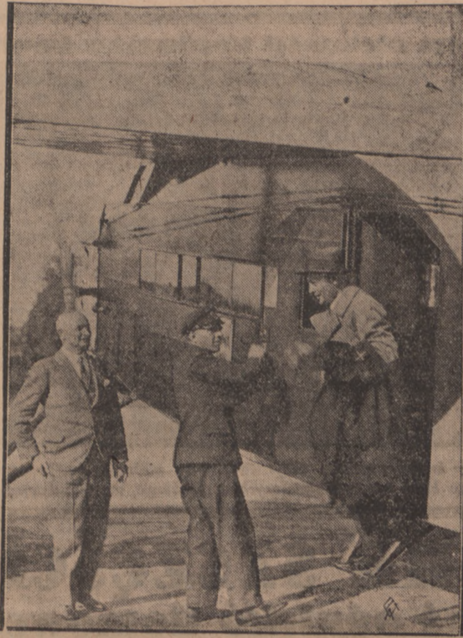
Powrócił z Rumunii do Warszawy pan prezes Rady Ministrów J. Jędrzejewicz. Podróż tę odbył pan premier w samolocie. Na zdjęciu naszym widzimy pana premiera (x) wysiadającego z samolotu