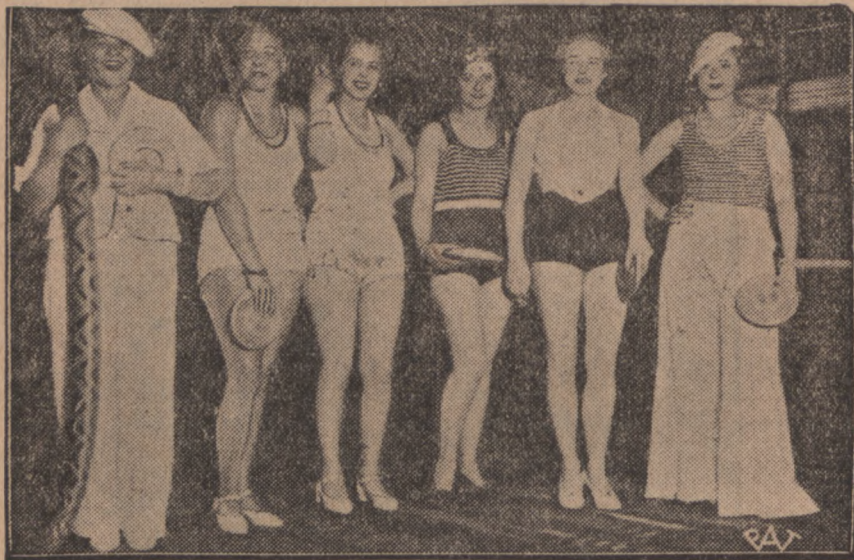
W Ostendzie — królowej mórz — odbył się konkurs piękności kostiumów kąpielowych. — Na zdjęciu widzimy kilka pań, uczestniczących w konkursie, w najmodniejszych kostjumach