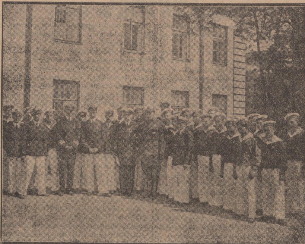
W tych dniach przejechała przez Warszawę sztafeta węglowa harcerzy morskich, wioząca bryłę węgla z Katowic do Gdyni. Celem sztafety była propaganda bezpośredniego połączenia miejsca produkcji z portem polskim. — W czasie przejazdu przez Warszawę członkowie sztafety przyjęci byli przez szefa Kierownictwa Marynarki Wojennej, kontradmirała Świrskiego (x)