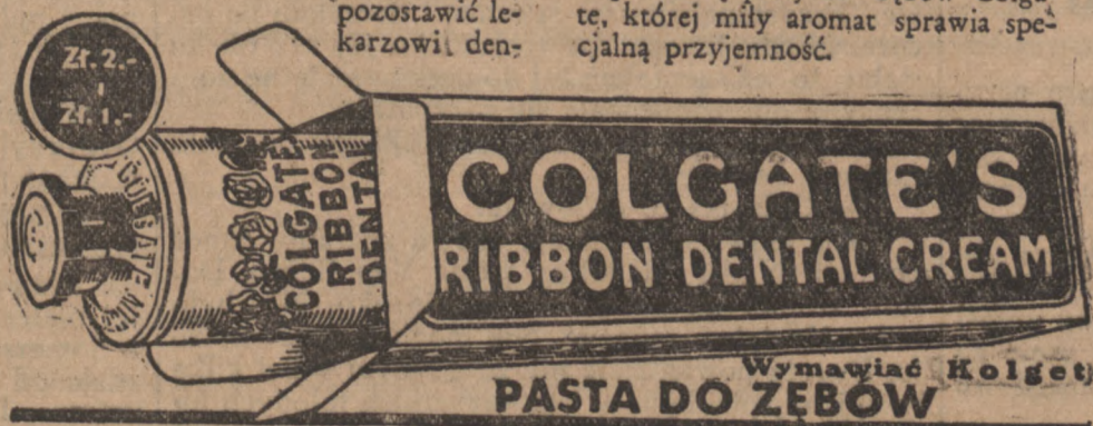
Wymawiań Colgate PASTA DO ZĘBÓW

Dzięki swej specjalnej właściwości czyszczenia pasta Colgate usuwa szkodliwe resztki pokarmów z najbardziej ukrytych szczelin pomiędzy zębami. Należy jeszcze dziś kupić tubę pasty do zębów Colgate, której miły aromat sprawia specjalną przyjemność.