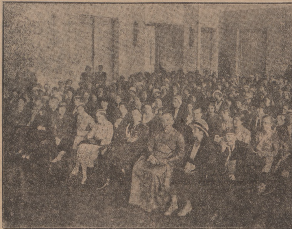
W Warszawie rozpoczęły się obrady VII Walnego Zjazdu przedstawicieli Stowarzyszenia „Rodzina Wojskowa”. Na zjazd przybyło 172 przedstawicieli tegoż towarzystwa, reprezentujących 118 kół „Rodziny Wojskowej”, grupujących ponad 15.000 członków z całej Rzplitej. Na zdjęciu naszym widzimy fragment sali obrad. W pierwszym rzędzie widzimy biskupa polowego W. P. ks. Gawlinę.