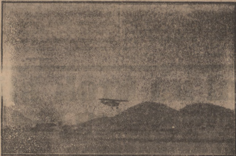
Na zdjęciu naszym widzimy samolot kapitana Skarżyńskiego R. W. D. 5 lądujący na lotnisku w Rio de Janeiro w dniu 11. V. 1933

Porto Allegre 10. 6. (PAT.) Znakomity lotnik polski Skarżyński wylądował pomyślnie w Porto Allegre.