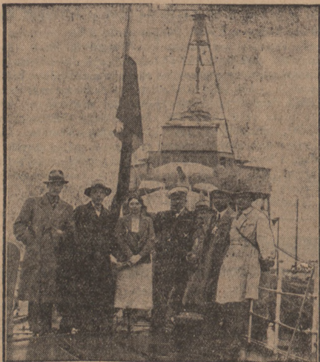
Dnia 3 bm. wypuszczono pierwszy bezpośredni Warszawa—Hel, nazwany „Strzałką Bałtycką“. Na inauguracyjny przejazd Ministerstwo Komunikacji zaprosiło licznych przedstawicieli prasy. — Na zdjęciu przodem widzimy przedstawicieli prasy po przybyciu do Gdyni, na pokładzie kontrtorpedowca „Wicher“