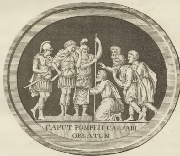
CAPUT POMPEII CAESARI OBLATUM

EJUSDEM AD CALPURNIUM PISONEM POEMATON PRÆMITTITUR NOTITIA LITERARIA STUDIIS SOCIETATIS BIPONTINÆ