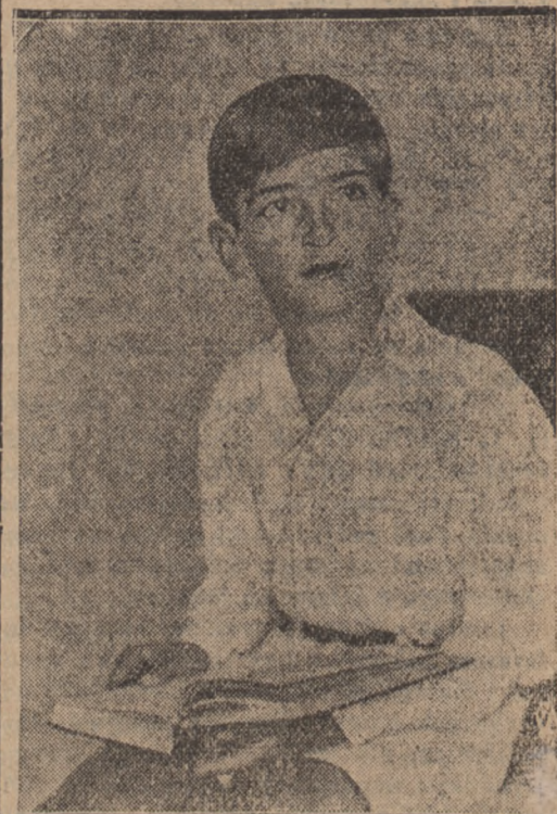
Książę Piotr, następca tronu Królestwa Serbów, Chorwatów i Słowenów, ukończył 6 września 10 lat. Rocznicę tę obchodzono wroczystie w całym kraju.