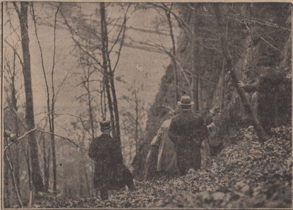
W poszukiwaniu zwłok króla Alberta w lasach pod Namur.