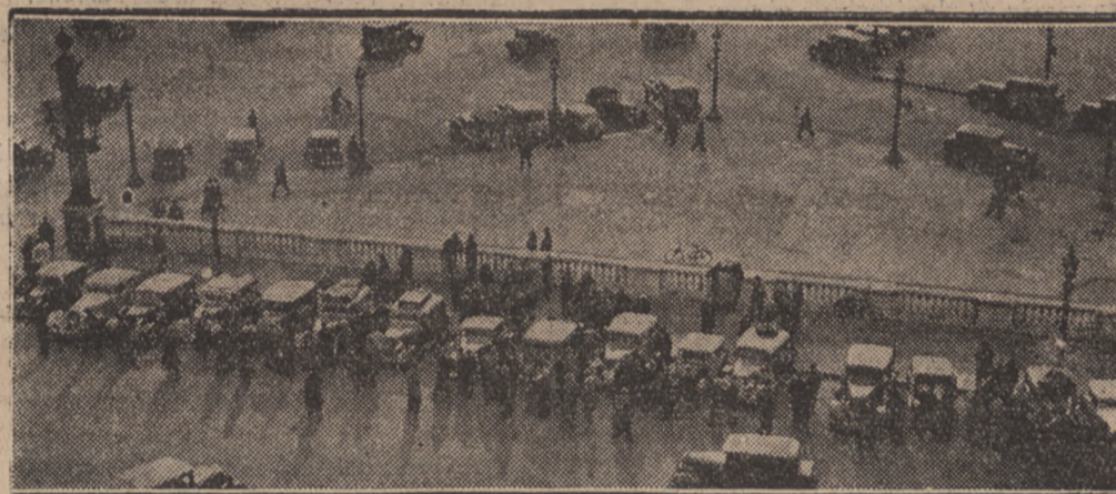
Postój w Paryżu