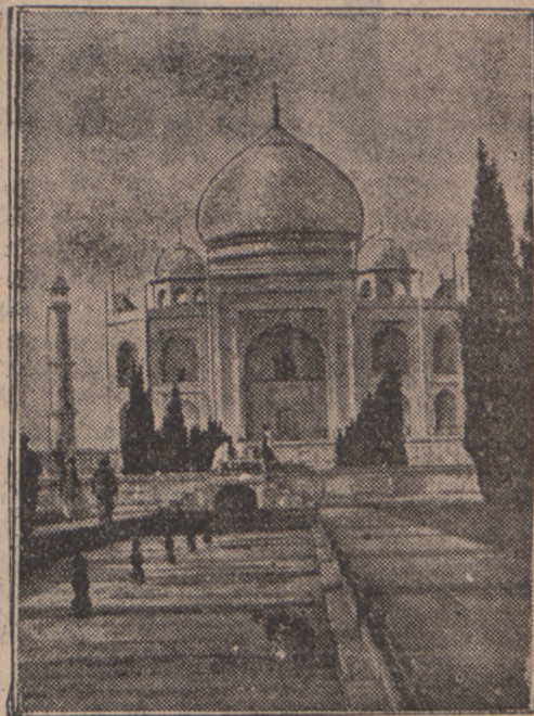
Taj Mahal, jedna z najpiękniejszych budowli historycznych świata, zburzona podczas ostatniego trzęsienia ziemi w Indjach.