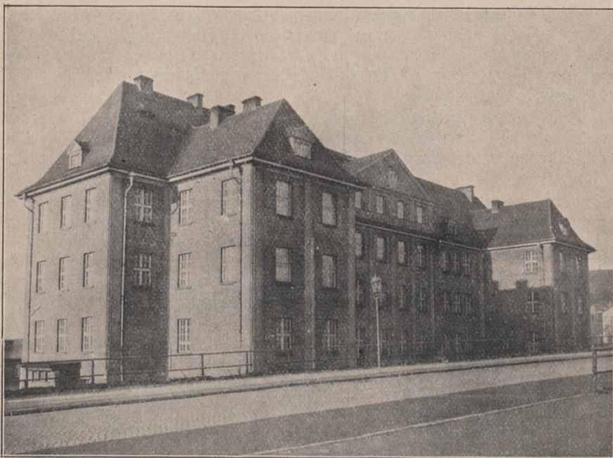
GIMNAZJUM POLSKIE W GDAŃSKU

1. Biblioteka profesorska oraz uczniowska polska. Na bibliotekę profesorską przypada obecnie 3.309 dzieł w 4.293 tomach, na uczniowską bibliotekę polską 2.272 dzieła w 2.432 tomach. Biblioteka profesorska posiada pozatem 170 czasopism w 620 tomach i zeszytach, oraz 300 dubletów, książek i broszur. Na składzie biblj. są 372 egzemplarze „Pana Tadeusza“.