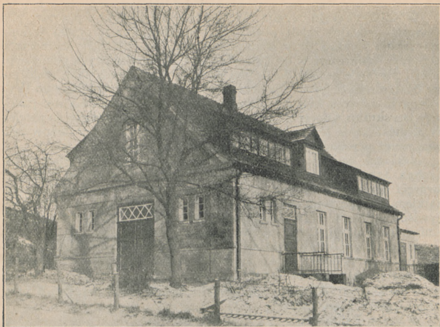
OCHRONKA W OLIWIE