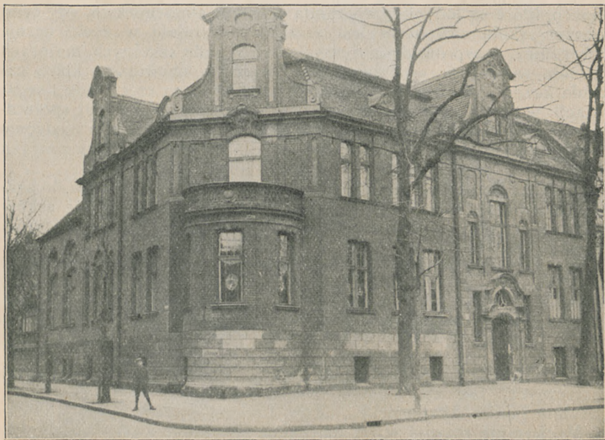
SZKOŁA HANDLOWA W GDAŃSKU

Założona w jesieni 1926 r. w skromnych rozmiarach rozwija się bardzo pomyślnie, a frekwencja uczącej się młodzieży w porównaniu z rokiem pierwszym podwoiła się w roku sprawozdawczym. Oprócz nauki szkolnej prowadziła Dyrekcja Szkoły jeszcze wieczorny kurs nauk handlowych, kurs języka polskiego dla dorosłych i kursa steno-