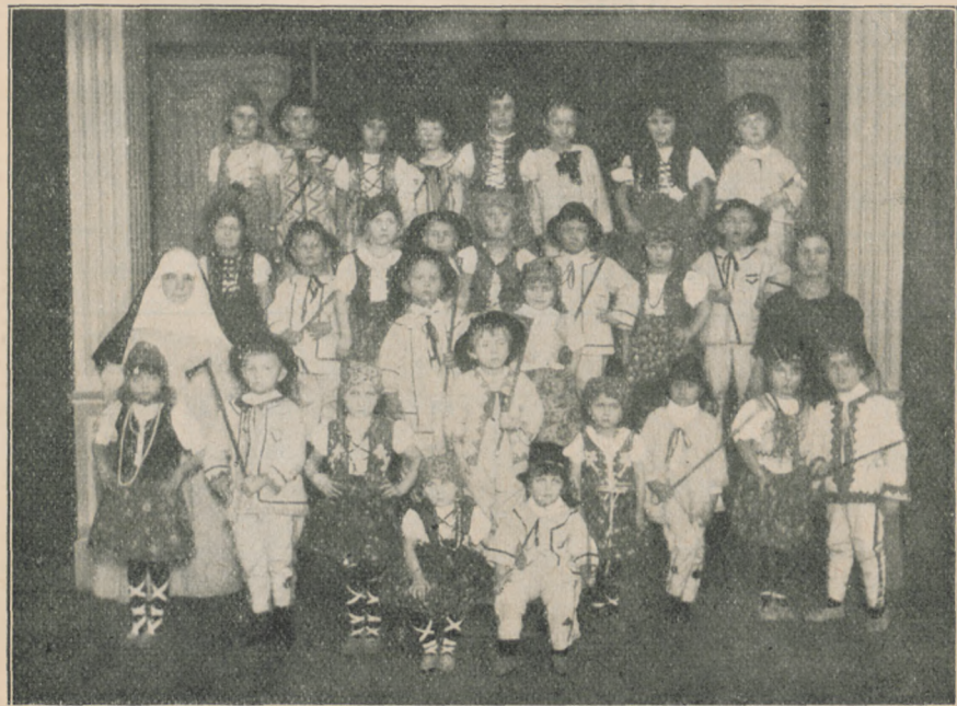
PRZEDSTAWIENIE DZIECI Z OCHRONEK POLSKICH W GDANSKU