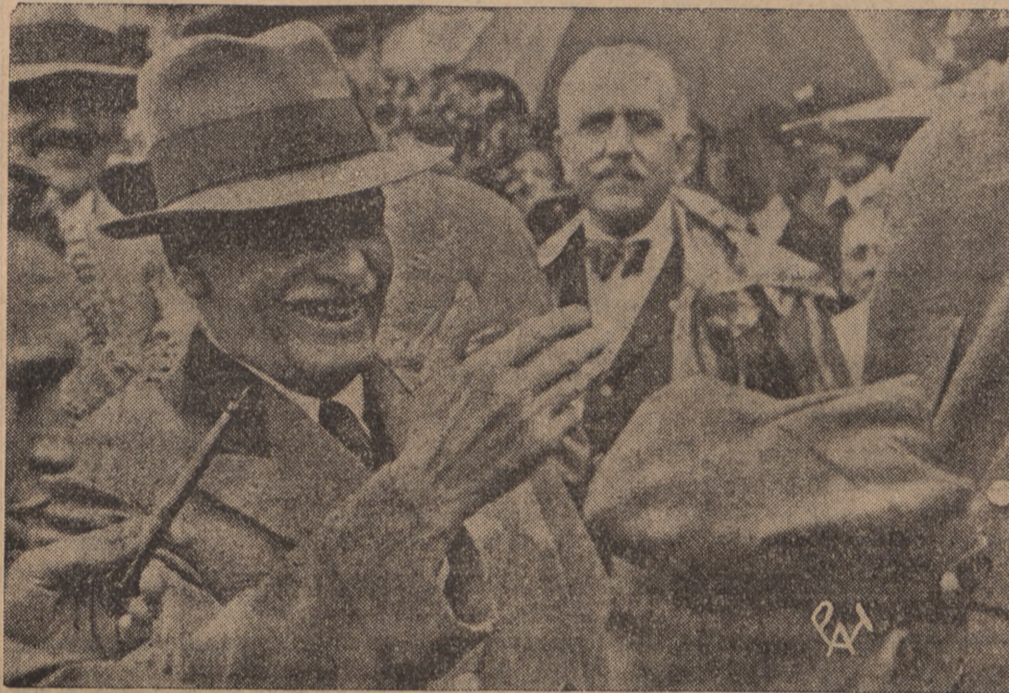
Po wielkiej defiladzie harcerskiej w Spale Pan Prezydent Rzplitej złożył swój podpis w księdze harcerskiej. Na zdjęciu — Pan Prezydent Rzplitej otrzymuje pióro do podpisu.