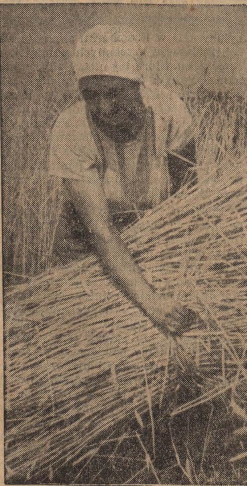
Zniwa się zaczęły.