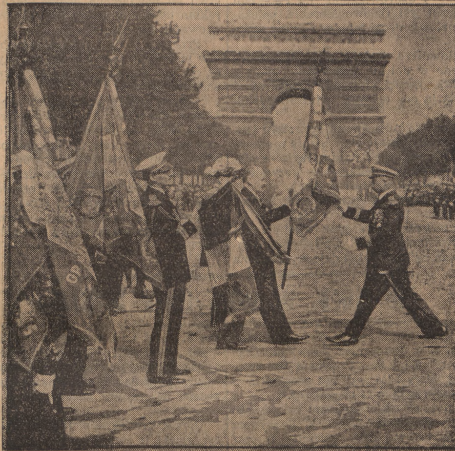
W niedzielę 14 bm. w czasie wielkiej rewii na Polach Elizejskich prezydent Lebrun wręczył oddziałom lotniczym nowe sztandary.