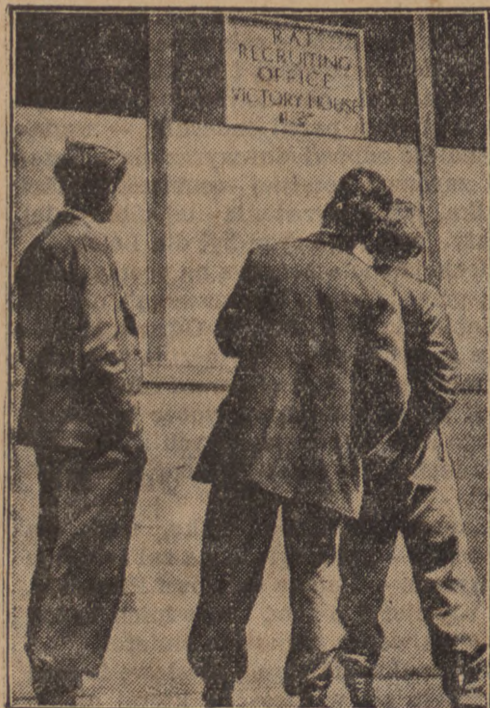
W związku ze zbrojeniami lotniczymi rząd angielski przez plakaty wzywa rekrutów do floty powietrznej.