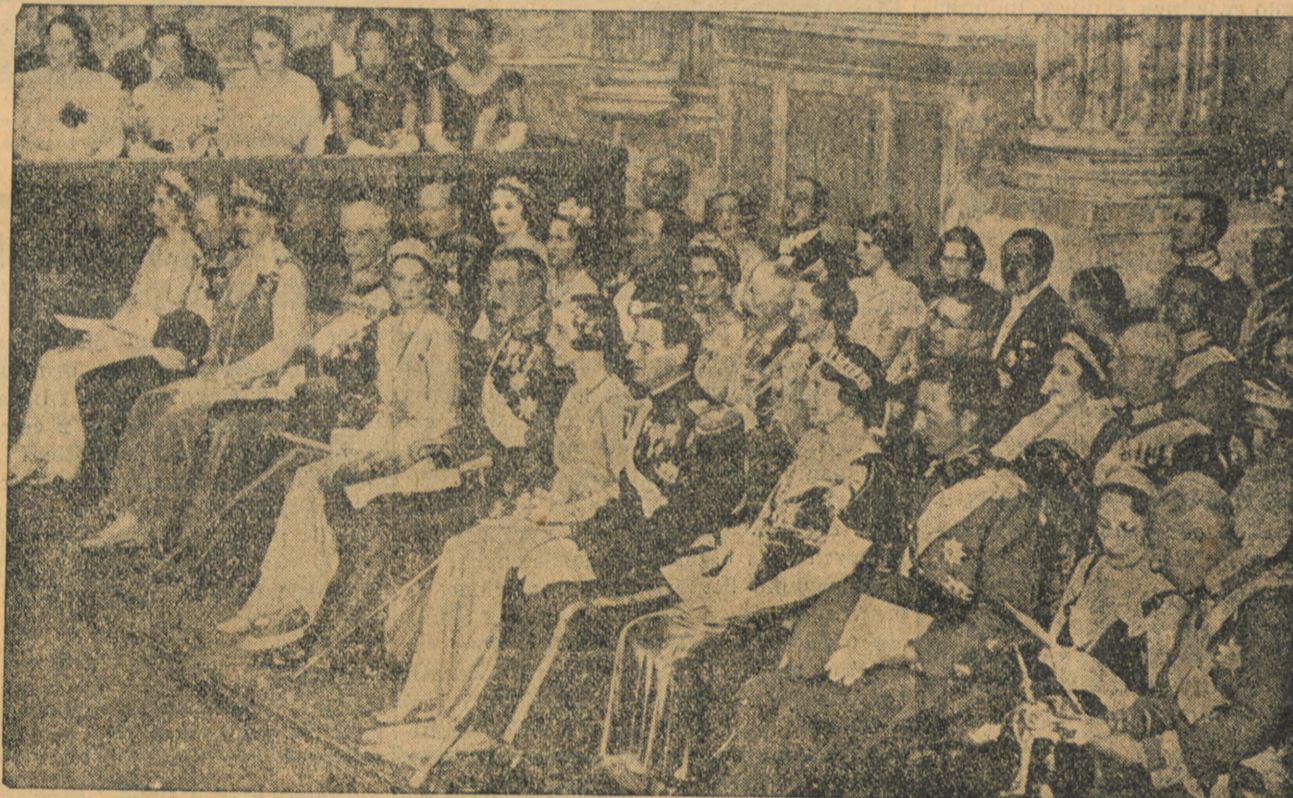
Zdjęcie z wielkiego przyjęcia na królewskim dworze szwedzkim, wydanego w zamku stockholmskim w dniu zaślubin księżniczki Ingridy, wnuczki króla Gustawa V z księżciem Fryderykiem, następcą tronu Danji. W pierwszym rzędzie od prawej: b. następcą tronu niemieckiego Wilhelm, następczyni tronu Norwegji, król Belgów, królowa Danji, pan młody i panna młoda, król Danji, królowa Belgów, król Szwecji, następczyni tronu Cecylja, następcza tronu norweski i następczyni tronu Szwecji.