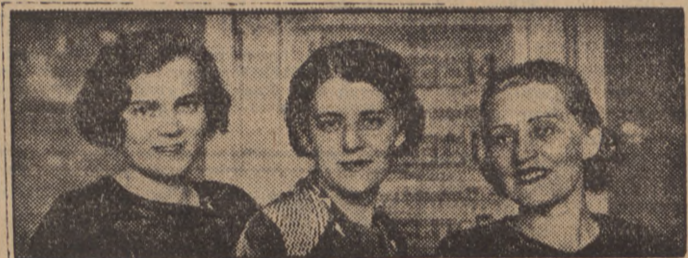
Trzy „milionerki” z Wolbromia.

Obecnie nadchodzą bliższe szczegóły, dotyczące tych wszystkich, którzy posiadali los numer 87,111, na który przed kilkoma dniami w 32 Loterii Państwowej padła główna wygrana w kwocie miliona złotych.