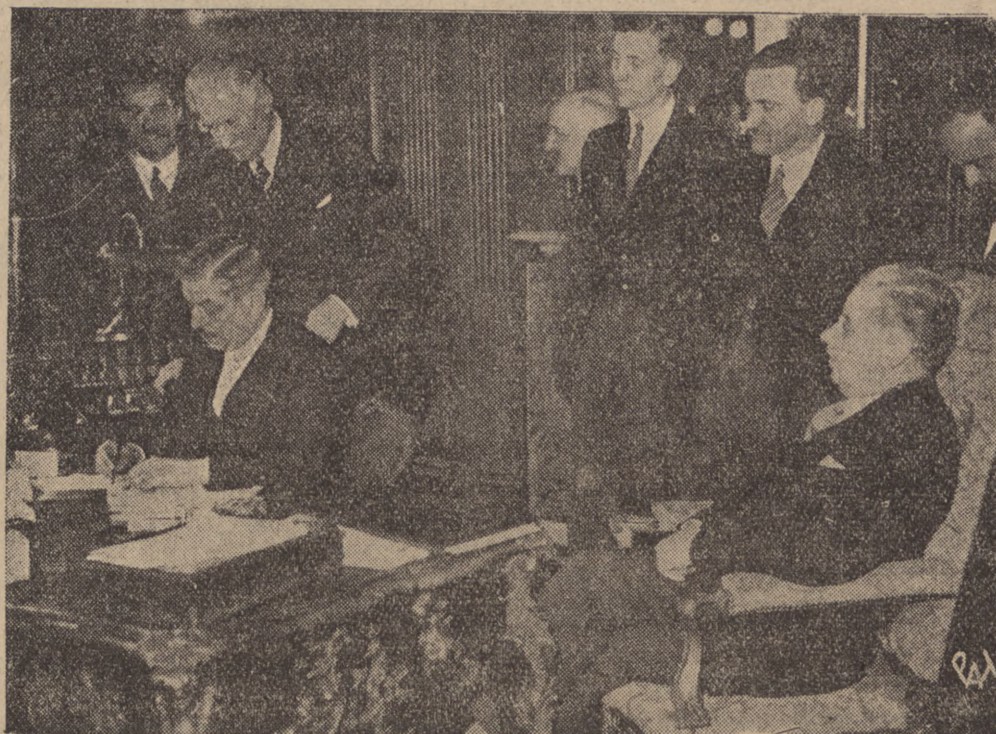
W Paryżu w dniu 2 maja. Na zdjęciu minister Laval i ambasador sowiecki w Paryżu Potemkin w chwili składania podpisów.