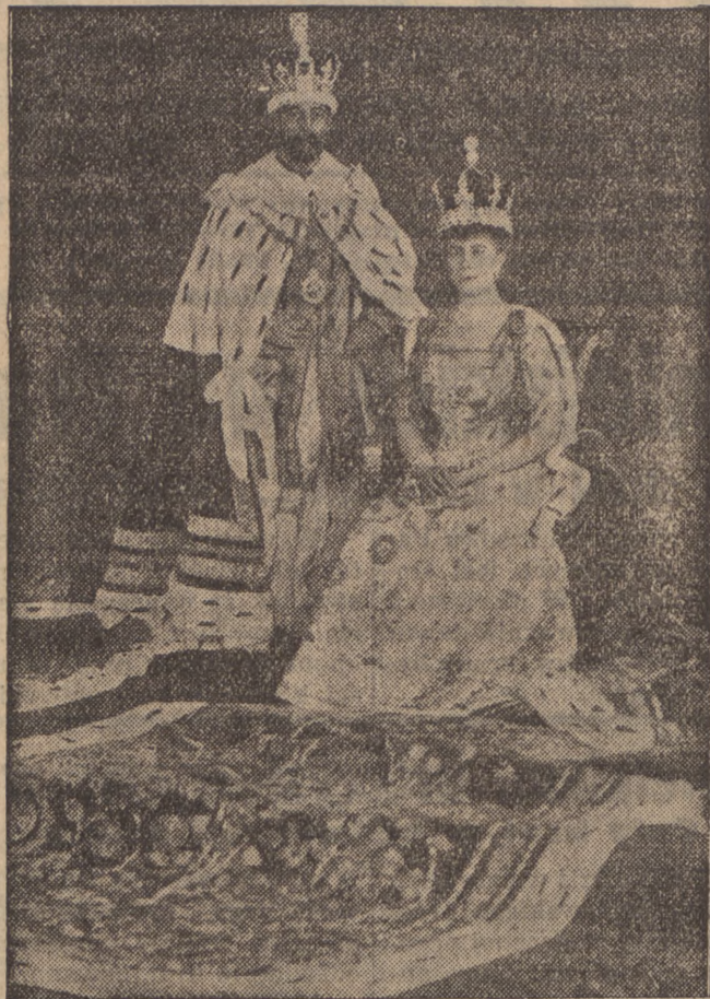
Angielska para królewska w pałacu Buckingham w Londynie w dniu koronacji przed 25-ciu laty.

Wśród wyróżnień i odznaczeń jakich król udzieli dla upamiętnienia 25-lecia swego koronacji, będzie również szereg przeznacz-