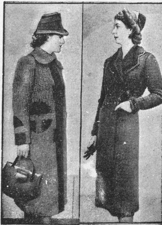
Skromne, a piękne płaszcze zimowe.

Ugotować smak z włoszczyzny, 3/4 kg buraków, korzeni, grzybów 100 g. Resztę buraków upiec lub ugotować, po czym obrać utrzeć na tarce lub cienko pokroić, dodać ewentualnie kwasu buraczanego, szczyptę cukru i cebulkę przesmażoną na maśle 2 dkg, zagotować parę razy i połączyć z przesmażonym smakiem. Przed podaniem przecedzić i podawać w filiżankach z uszkami. O ile uszka dajemy gotowane, podać