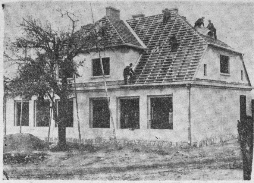
Budynek pod dachem. Publiczna szkoła powszechna w Nielbarku, pow. lubawski, wzniesiona z pomocą Towarzystwa Popierania Budowy Publ Szkół Powszechnych

Zakończono zebranie odśpiewaniem „Hymnu Młodych”, którym je też rozpoczęto i „Pieśnią Bojową” oraz okrzykami na cześć Romana Dmowskiego i władz S. N.