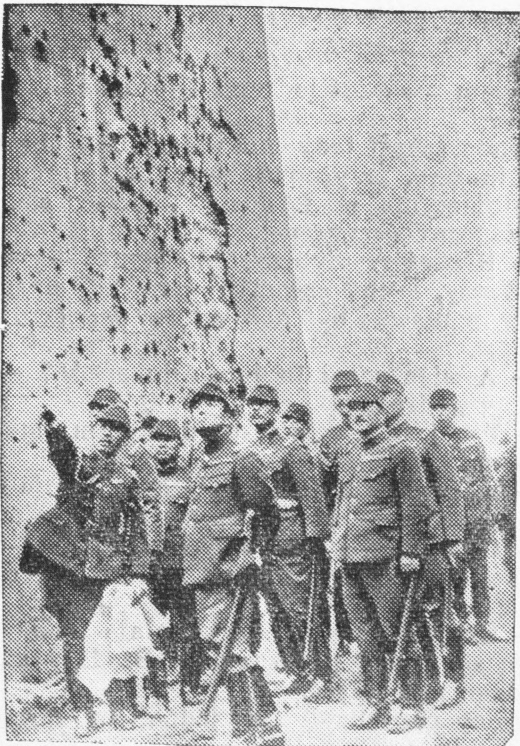
Brat cesarza japońskiego książe Higashikuni w otoczeniu sztabu zwiedza front chińsko-japoński.

Nowy Jork. Organ katolików niemieckich w St. Paul podaje ze źródła bardzo pewnego, że b. kanclerz Austrii dr Schuschnigg został doprowadzony przez ostatnie wydarzenia i „opiekę” nazistów do załamania umysłu. Zdaje się to potwierdzać również komunikat władz niemieckich o ponownym odłożeniu procesu przeciwko b. kanclerzowi. Organ Niemców amerykańskich skierowuje apel do Kongresu Stanów Zjednoczonych, by w imię sprawiedliwości i humanitaryzmu poruszył sprawę tę publicznie, domagając się wyświeślenia losu b. kancl. Schuschnigga i zamiarów władz niemieckich wobec niego na przyszłość.